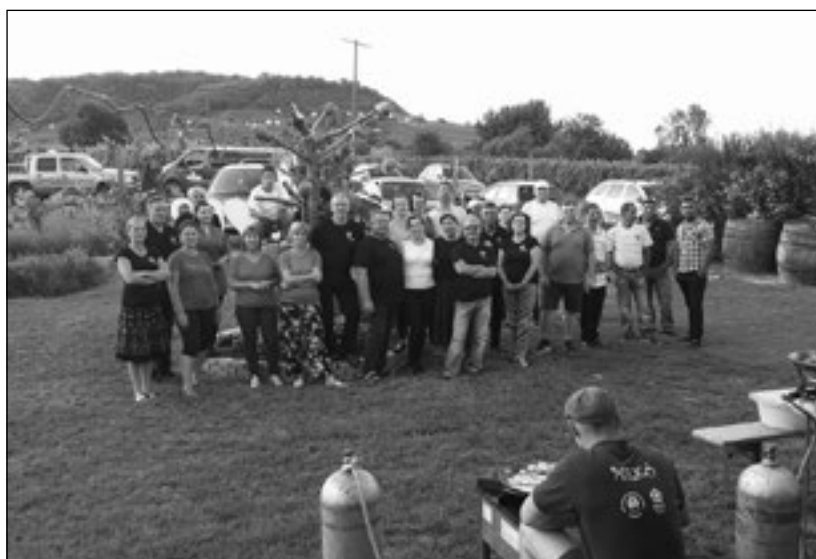
Bozót Táncegyüttes a Somlón

A tábor vezérgondolata a közös világban való együttélés, a különböző társadalmi rétegek közeledé-