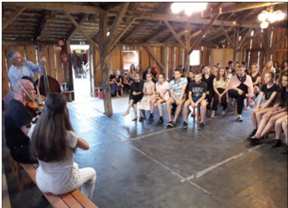
Táncos tehetségek Tábora

Sokat neveltünk a záró gálán, ahol a fiatalok által koreografált, vicces műsorszámok is bemutatásra kerültek.