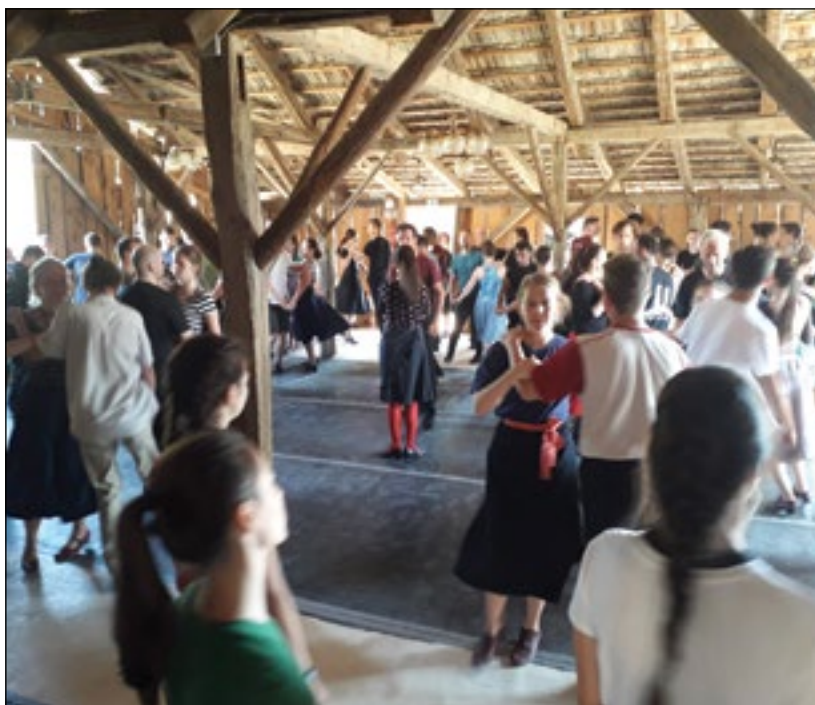
Gyakorló Néptáncosok és Táncoktatók Tábora

Büszkék vagyunk arra, hogy a tábor híre világszerte terjed. Sok résztvevőnk volt Nyugat-Európából, Erdélyből, Felvidékről, de Japánból is érkezett két vendég.