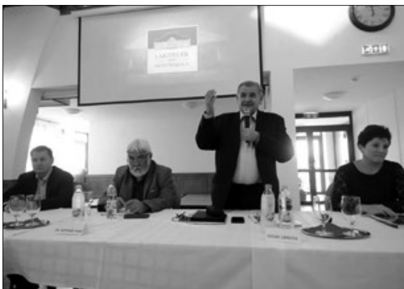
Kincsek a Kárpát-medencében, Értéktáró kollégiumok szabadegyeteme – 2018. június 26-30.

Az Értéktáró Kollégiumok szervezésével a külföldi és a belföldi magyar értéktár bővítését segíti a lakiteleki Népfőiskola programozata. Hiszünk benne, hogy jelen értéktáró és értékmentő célzatú programunk nagyban segíthet a külföldi magyarság megmaradás folyamatában, lassíthatja az elvándorlást, az értékek mentén a helyi kitörési pontok megtalálását. Az anyaországban belül szintén nagyon fontos az értékek és értékörzők védelme, segítése, megjelenési lehetőségük kiterjesztése, melyben nagyon fontos szerep jut a jelen kutatássorozatnak.