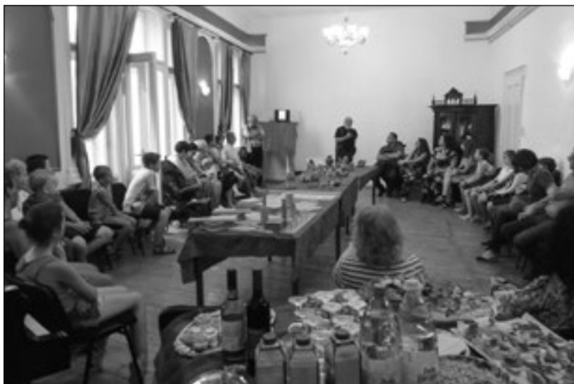
Az Erzsébet Terem

2016-ban létrehoztuk az Agro-kézdíszék Mezőgazdászok Egyesületét, amely célul tűzte ki a környékünkön, a Kézdíszéken levő, főképpen kisgazdák, kistermelők felkarolását. Támogatjuk őket, de főképpen azzal a céllal, hogy feljűk információkat vigyűnk. Kovászna megyében a kisgazdaságok, nyugodtan el lehet mondani, hogy kihalófélben vannak. Kovászna megyében a nagygazdaságok jellemzőek vagy nagymértékben jellemzőek, amik a kisebbeket félretolják, és azután a területeiket felvásárolják. Mi Kovászna megyében sok szándékot nem látunk a kisgazdaságok megtartására, és itt láttunk egy tevékenységi területet, amely hozzánk is közel áll, és ahol gyakorlatilag van tennivaló. Ennek érdekében az egyesület keretén belül előadásokat tartunk. Nem tanítjuk a gazdákat gazdálkodni, mert azt sokkal jobban tudják, de ha pályázatokról szerzűnk tudomást, akkor tájékoztatjuk őket, vagy előadások keretén belül, vagy a Facebookon keresztül, vagy e-mail-listára küldve. Ugyanűgy veszűnk részt kiállításokon, ahol a helybeli kisgazdák termékeit mutatjuk be –