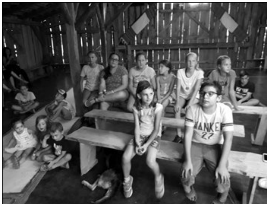
Tábor hátrányos helyzetű gyerekeknek

Programjukat játékos vetélkedősorozat kísérte végig. A programból a lovaglás örömei sem maradtak ki.