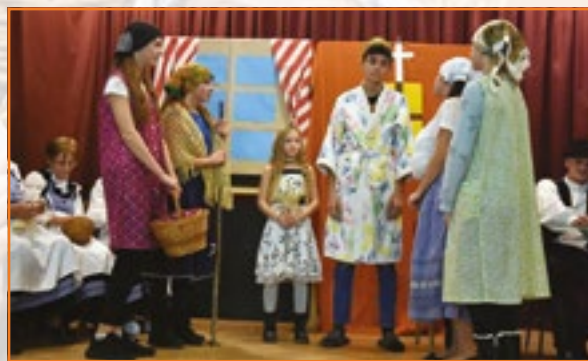
A 946 fős település, Nyárad színjátszó csoportja a nyáradai asszonyok életéről állította össze előadást.