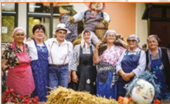
A Somogy megyei Mesztegyő Honi Hagyományörzők közössége Aratás címmel visz színre egy népi játékot.

Ötödik évadának végéhez közeledik a Pajtaszínház program, amelyet 2015 óta valósít meg a Nemzeti Művelődési Intézet a Magyar Teátrumi Társasággal együttműködve azért, hogy a településeken ismét elterjedjen az amatőr színjátszó tevékenység, színesítve a helyi kulturális életet, s színházi élményhez juttatva a lakosokat.