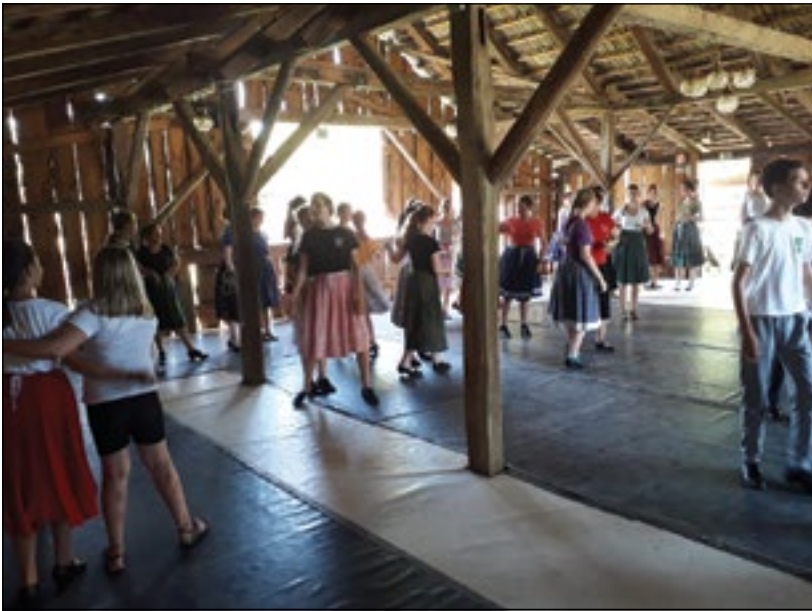
Táncos tehetségek tábora

résztevőknek. Táncoktatások mellett népi játékok, kézműves foglalkozások, kirándulások, lovas programok, daltanulás, szalonnasütés színesítette a tábort. A gyerekek ezzel a programmal koronázták meg egész éves táncos élményeiket, próbái munkájukat.