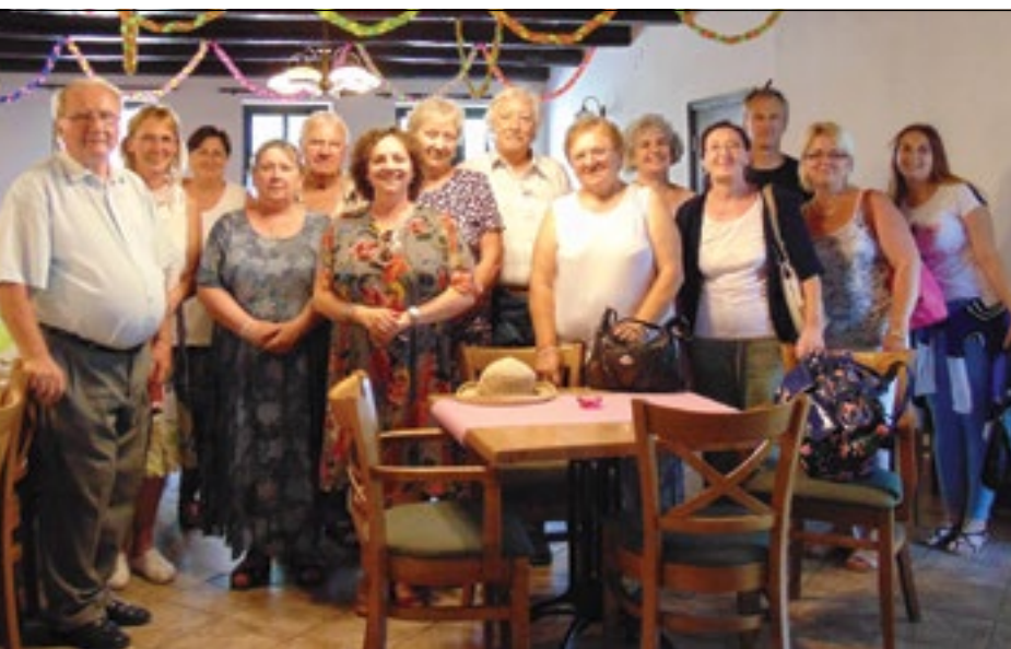
Jakabszállásról érkeztek vendégek a Baranyai Népfőiskolára

Az ebédre már Kaposmérőn került sor, ahol a fehér abrosz mellett