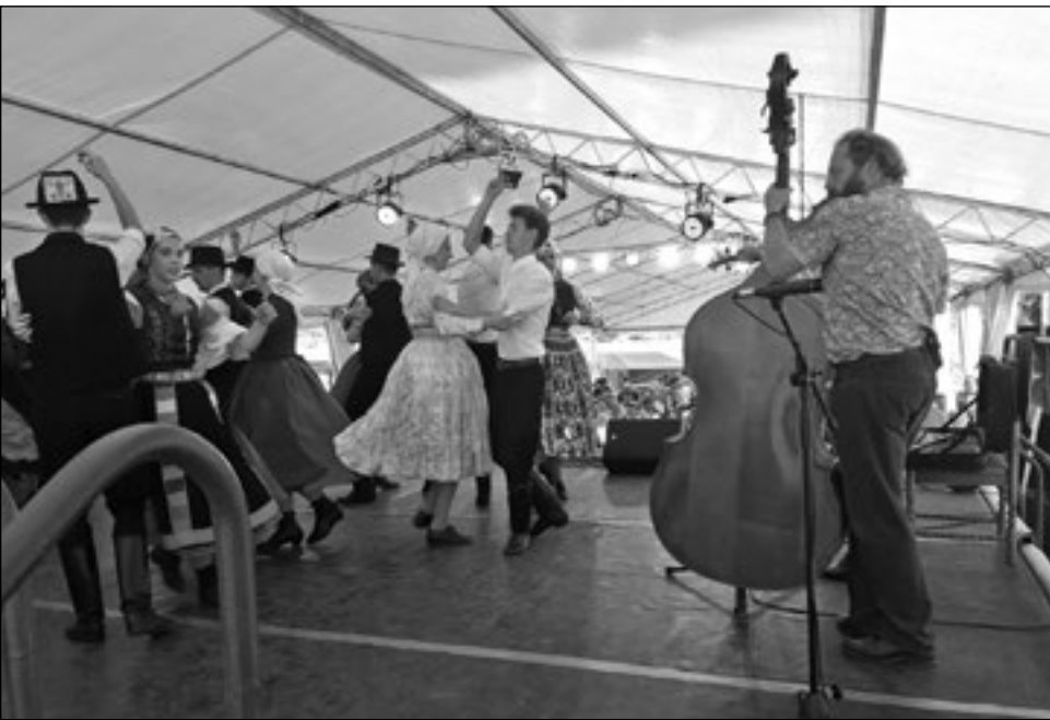
Folk nap Csöglén

nyomán kedvet kaptak a népművészeti események szervezéséhez. Az elmúlt nyáron szinte minden térségbeli falu felkérte néptáncosainkat és népzeneészeinket, hogy előadásokkal gazdagítsuk falunapi rendezvényeiket.