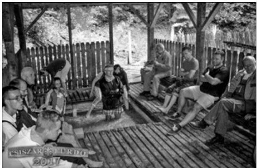
Kalákásokkal a Csiszárfürdőn

A második projektünk, miután a Csiszárfürdőt elkezdtük és megvásároltuk '11-ben, '14-ben körülbelül felépítettük Kézdivásárhelyen az Erzsébet-termet. Az Erzsébet-terem egy rendezvényterem, amelyet a Praetoria* Egyesület mű-