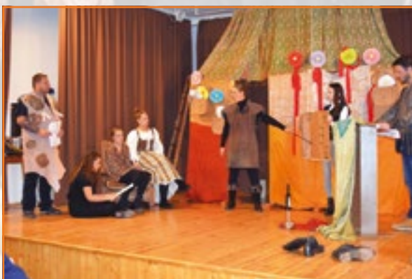
A bősárányi társulat zenés abszurd álnépmesét visz színre.