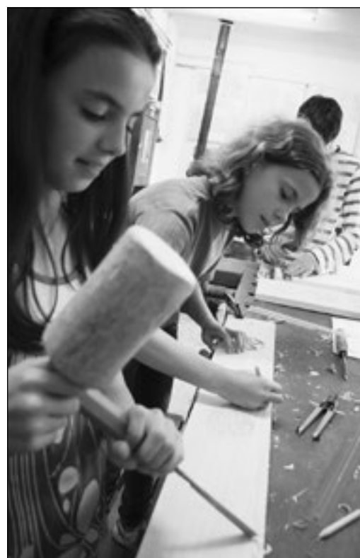
Faragás oktatás a Csiszár Dénes Tanműhelyben