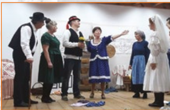
Az egervári csoport Illyés Gyula Tívé-tevők parasztkomédiáját próbálja.