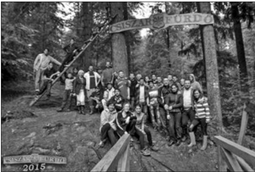
Kaláka a Csiszárfürdőn

volt, hogy nemcsak anyagilag kapcsolódjunk ehhez a kontinuitáshoz, de szellemileg is. És amint az anyagi helyzet ezt megengedte, és amikor a birtokot annyira sikerült felépíteni, persze próbáltunk is ebből valamennyit visszaadni és közösségi projekteket indítottunk útnak.