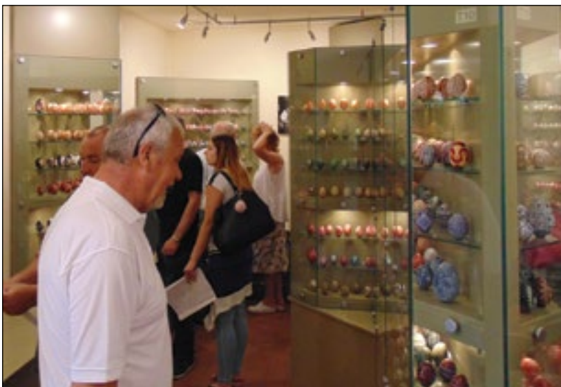
Látogatás a Míves Tojás Múzeumban, Zengővárkonyban