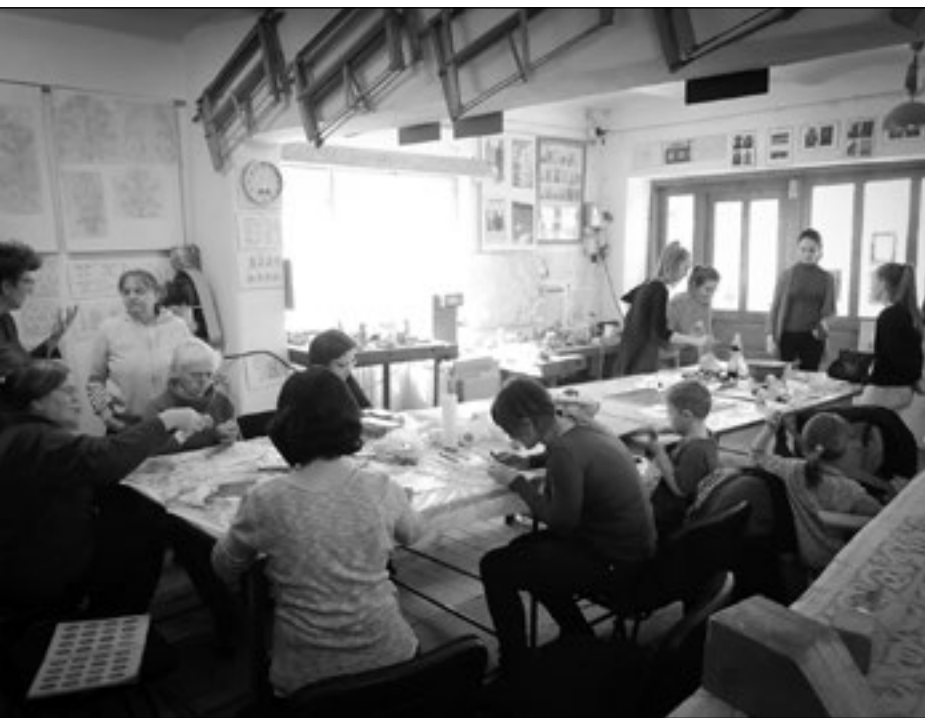
Tojásírás oktatás a Csiszár Dénes Tanműhelyben

képzelné, hogy nem egy kis családi vagyonról volt szó, és Kézdiszéken szinte minden faluban volt olyan tulajdon, amit visszaigényeltünk. Tehát volt itt egy kis darab kert, ott egy kis darabka legelő, és ez mind azt jelentette, hogy szembe kellett menni a hatóságokkal. És a román államot persze a helyi hatóságok képviselték, tehát a helyi polgármesterek, helyi tanácsok, és persze senki sem adta szívesen ki azt a legelőt. Annak ellenére, hogy úgy éreztük, és a törvény is azt mondta, hogy jogosak vagyunk erre a visszaszolgáltatásra. De ez azt eredményezte, hogy minden csak per által működött. Így hét éven át nagyon sok tapasztalat született abban, hogy hogy működik a helyi rendszer, a helyi politikum – annak ellenére, hogy mi talán mit vártunk volna el a német rendszer, a nyugati országokban működő rendszerek ismeretében. Ez persze nem volt meg Romániában. Ami részben előny is az életre nézve, mert a túlrendszerezés azért nem olyan életbarát. De ami a jogrendszerrel illeti, ez egy hátrányt jelent. Körülbelül 7 év után jött egy olyan döntés, hogy ez nemcsak nekünk nehéz, hanem