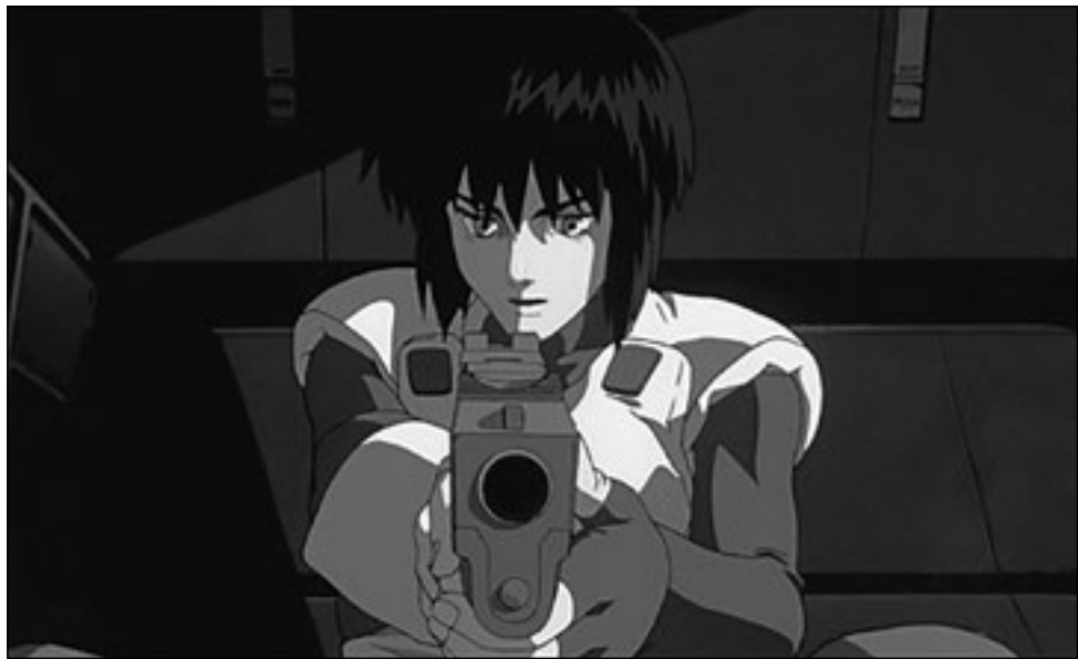
Kusanagi Motoko kiborg őrnagy ( Ghost in the Shell , 1995)

2004-ben készült el a kiváló japán rendező, Mamoru Oshii 1995-ös korszakos cyberpunk rajzfilmjének, a Ghost in the Shell nek a második része. Az 1995-ös kultfilm megszületésére hatással volt Ridley Scott 1982-es filmje, a Szárnyas fejvadász , aminek alapjául Philip K. Dick: Álmodnak-e az androidok elektronikus báránnyal? című regénye szolgált. De legalább ennyire fontos lehetett Mamoru Os-