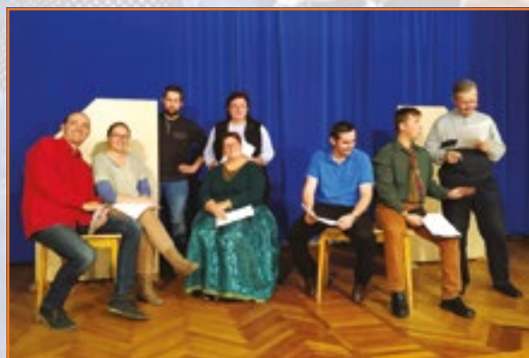
A jókedvű jánoshidai csapat Niccoló Machiavelli: Mandragóra cím komédiáját próbálja.