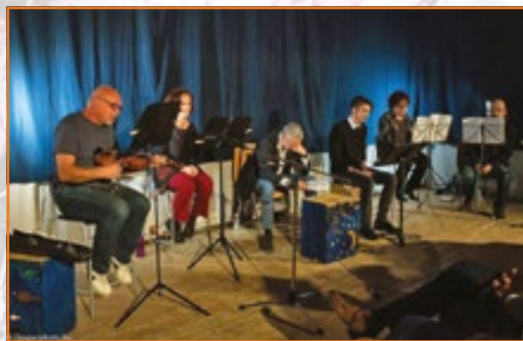
A Mányi Színjátszó Kör Kelj fel és járj! – előadása József Attila Szabad ötletek jegyzékének és korai verseinek felhasználásával készül.