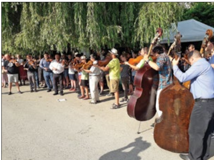
Dűvő Népzenei Tábor

Az érdeklődők a világ különböző részeiről érkeztek. Magyarországról Jászberényből és Szegedről érkezett nagyobb csoport, és sok volt az egyéni érdeklődő. Voltak vendégeink Angliából, Amerikából, Ausztráliából, Kanadából és Európa országából.