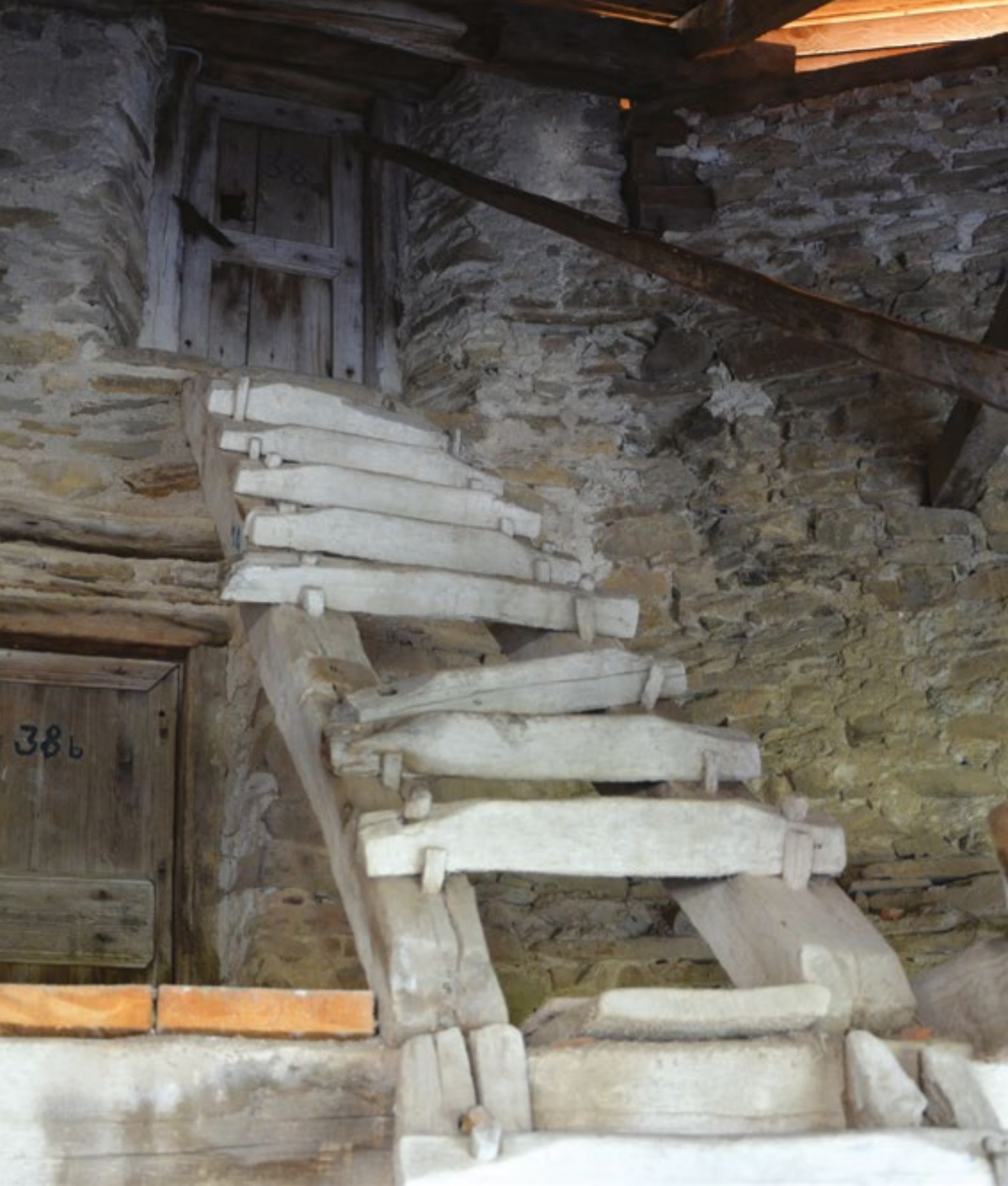
A SZÉKELYDERZSI ERŐDTEMPLOM TÖBB SZÁZ ÉVES LÉPCSŐJE