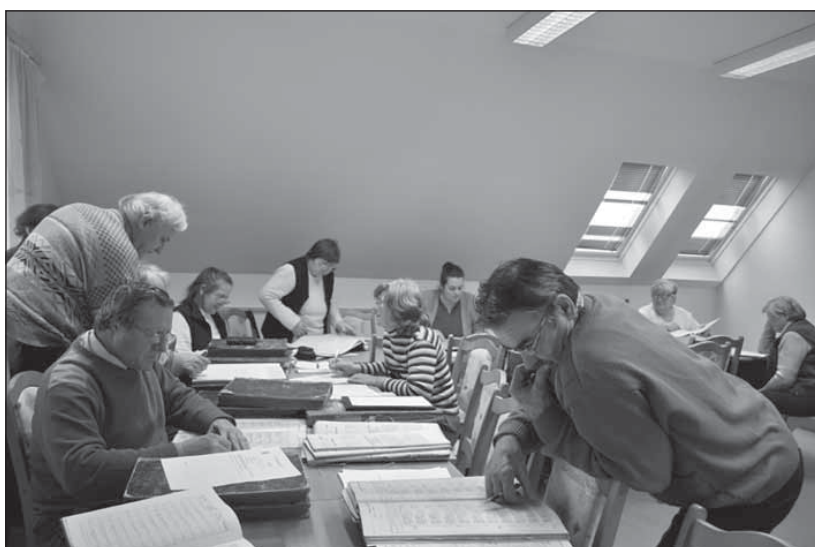
A mezőtúri családtörténet-kutató egyesület tagjainak látogatása a szolnoki levéltárban

A szabadidős célú, „amatőr” – és itt a jelzőt korántsem a kutatásmódszertani felkészültségre, vagy az elért eredményekre, hanem a kutatás célmeghatározására értjük – családtörténet-kutatás nagyszerű lehetőség az azonos érdeklődési körrel, azonos célokkal, azonos értékrenddel és a családtörténeti forrásokhoz való hozzáférés terén azonos érdekekkel rendelkező társadalmi csoportok számára, hogy összetartozástudatukat megfogalmazva, cselekvőképes és egymást segítő tagokból álló közösséggé formálódjanak. E tevékenységet pedig a közgyűjtemények és a közművelődési intézmények – mint a helyi és nemzeti kultúra és a műveltség közvetítésének, a közösségek szervezésének meghatározó szereplői – ma már számos formában képesek támogatni. Ezek az intézmények nemcsak felismerték a családtörténet-kutatás társadalmi