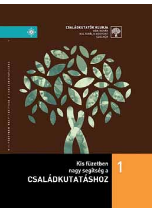
A „Kis füzetben nagy segítség családkutatáshoz” című kiadványsorozat első kötete

nemcsak egyértelműen társadalmi, kulturális értéket teremtenek, de az azonos célokkal, értékrenddel és közösségtudattal rendelkező klubok, csoportok létrejötte révén a társadalom önszerveződése, az aktív és értékközpontú közösségi cselekvés szempontjából is nagy jelentőséggel bírnak.