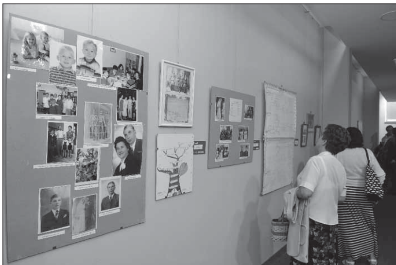
Részlet a „HETEDÍZIGLEN – családfakutatás napjainkban” című kiállitásból

bevonásával kutatják a múltjukat, keresik a szétszóródott hozzátartozókat. Közülük vannak, akik még a levéltárakba sem jutnak el, és elért eredményeiket is csak szűk körben, általában családon belül terjesztik.