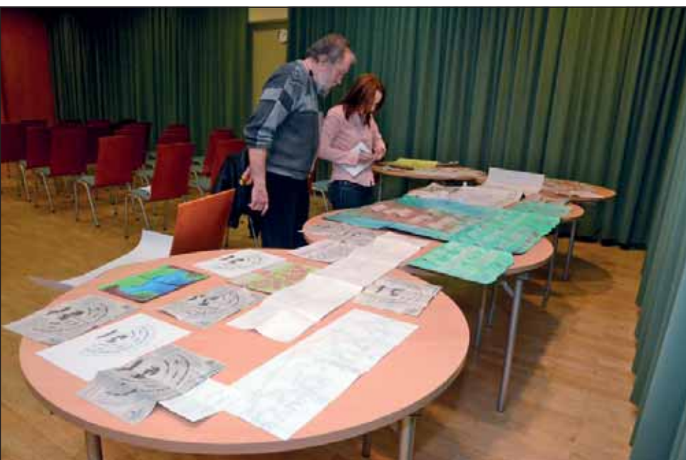
A 2011-es családfa készítő pályázat értékelése

A társadalmi tőke olyan erőforrás, amely elsősorban a közösségekhez kapcsolódik, a közösségek összetartozástudatából nyeri alapját. Az értékalapú és kultúraközpontú gazdaságfejlesztés aspektusából immár felértékelődni látszik a helyi közösségek, a lokális értékek jelentősége, a személyes kapcsolatok és társadalmi önszerveződések szerepe. A gazdaság- és társadalomtudományok új szempontú megközelítése szerint a társadalom tagjainak közérzetének alakulásában, sőt a gazdasági versenyképesség növelésében is meghatározó szerepe van a közösségi, kulturális és területi alapú tőkének is, vagyis az egyén és a közösség kapcsolatrendszerének, a kulturális értékeknek, a helyi identitásnak. Az amatőr családtörténeti kutatások a múlt emlékeinek megőrzésével, a lokális és családi összetartozástudat gondozásával, a hagyományok tiszteltével, aktív időtöltésre ösztönző közösségteremtő hatásukkal