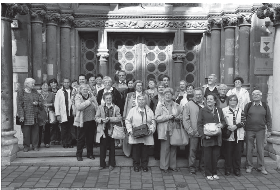
A szolnoki és mezőtúri családtörténet-kutató klub tagjainak látogatása az Országos Levéltárban

a társadalmi tőke megerősítéséhez. Eddig talán kevesebb figyelem fordult a családtörténet-kutatás céljával létrehozott közösségekre, napjainkban azonban ez a helyzet – mind a társadalmi érdeklődés növekedése, mind a közművelődési intézmények megváltozott álláspontja miatt – alapvetően átalakult.