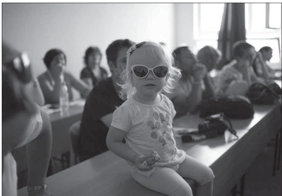
Természetes, hogy mindig gyerekek vannak körülöttünk

többféle ingyenes tanácsadó szolgáltatás is működik: általános jogsegély (NOE-FON), otthonteremtés, családi és szociális ellátások, fogyasztóvédelem, gyermeknevelés. Fontos feladatunk továbbá a gyermekek és fiatalok közéleti nevelése, a természet szeretetére, óvására és a környezettudatos magatartásra nevelés, a szenvedélybetegségek megelőzése, az egészségfejlesztés. Az egyesület vezetésével működik a pécsi Család, Esélyteremtési és Önkéntes Ház is. Mindemellert adománygyűjtéseket is szervezünk: évente két alkalommal, az egyik áruházlánccal közösen, gyűjtenek fiataljaink. Egyik alkalommal a fiatal házások, másik alkalommal az idősek támogatása a cél. Működik Angyali Csomagküldő Szolgálatunk, amelyben önkéntes felajánlásokat gyűjtünk célzottan egy adott család támogatására. Évente több támogatáskérő levelet kapunk, s az ezekben megfogalmazott kérések alapján várjuk a felajánlásokat, ezzel is bearanyozva az adott család karácsonyát. Emellett művészeti pályázatokat is hirdetünk, amelyekből már két gyönyörűen kivitelezett könyvünk is készült: a Miért lettem nagycsaládos? és a