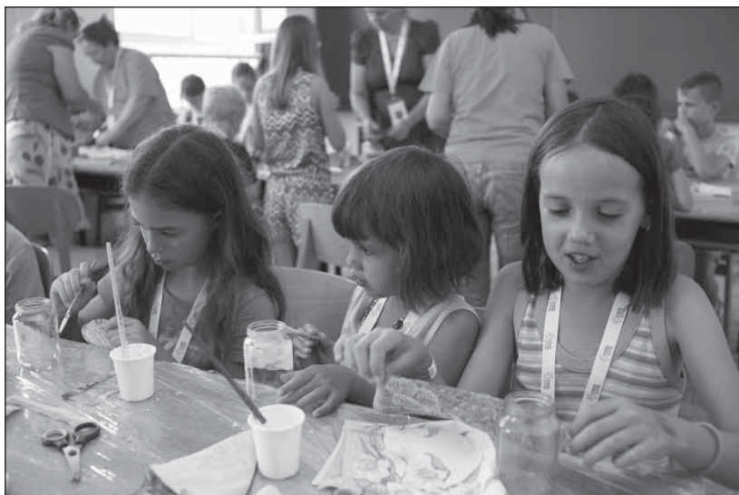
Kézműves foglalkozás az egyik NOE rendezvényen

ciákra, tudásmegosztó alkalmakra lehetőség szerint előadókat delegálunk. Örömünkre, a Nemzeti Művelődési Intézet vállalta, hogy országos jótékonyági kampányban adománygyűjtő pontokat biztosít megyei igazgatóságaiban, és a jótékonyági kampányokat partnerei és célközönsége körében is népszerűsíti. A Komátál Program Kárpát-medencei alkotópályázat megvalósításában is aktívan együttműködünk egymással.