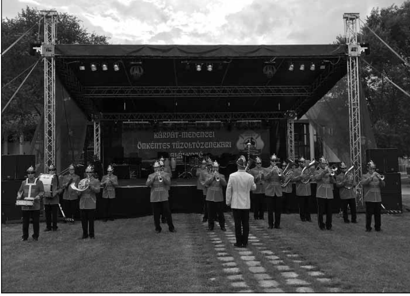
Kárpát-medencei Önkéntes Tűzoltózenekari Találkozó Lakiteleken

összesen 307,58 hektárra). Azonban azt is látni kell, hogy nemcsak az egykori tudást és tapasztalatokat kell újra elővinnünk, és ennek a tudásnak a korszerűsítését kell elvégeznünk: fontos az is, hogy legyen megfelelő mennyiségű és minőségű vetőmag, modernizálnunk szükséges az agrotechnikai eljárásokat és megfelelő betakarítógépre is szükség van. Ez azt jelenti, hogy a korszerű, piacképes termékek érdekében az egész folyamatot, a teljes termesztési, feldolgozási vertikumot jelentős innovációval fel kell építenünk.