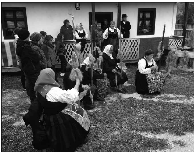
A kenderfonal hagyományos készítésének bemutatása fiataloknak Csíkszentdomokoson

A Nemzetstratégiai Kutatóintézet pedig olyan, szintén Kárpát-medencei kiterjedésű EFOP projektet indít, melyben már egy konkrét foglalkoztatási modellt kívánunk megalkotni az ipari kender termesztésére és feldolgozására – ezt Észak-Magyarországon, illetve a Dél-Alföldön fogjuk megvalósítani. Tehát azokkal a gazdákkal, akik kenderet termesztnek, illetve azokkal a kézművesekkel, akik már most kender alapanyagból készítenek termékeket, vagy pedig nyitottak erre, ki fogunk alakítani egy összefüggő foglalkoztatási rendszert, egy máshol is alkalmazható modellt. A két intézet fenti EFOP-os projektjeivel párhuzamosan pedig reményeink szerint elindulhat majd az Erdélyi Kulturális Közösségi Mintaprogram is, amelyre már a kormányhatározat megszületett, s melynek a gazdája a Nemzeti Művelődési Intézet.