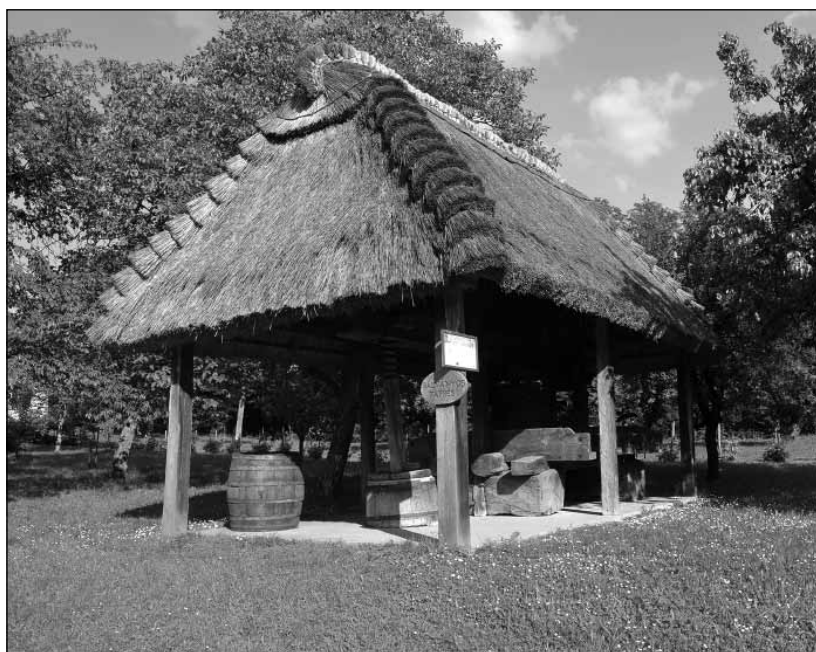
2015. Jövőnek átmentett örökség Oszkón

Tehát a látóút egy tapasztalati vagy cselekvő tanulási folyamat a résztvevő aspektusából, mely folyamatban újfajta tudást, készségeket sajátít el, valamint a közvetlen ta-