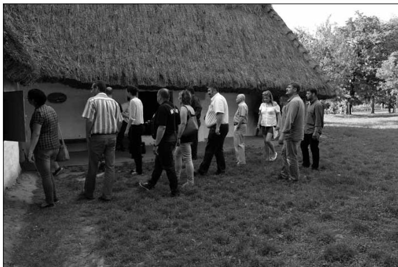
2015. Az Oszkói Hegypásztor Kör Egyesületnél vendégségben

„népművelőjének” legfontosabb feladata a helyi kulturális közösségek megerősítése, segítése lehet. Munkájának kiinduló pontja a társadalmi hasznosság, célja pedig az önmaga értékét felismerő, ezért magára büszke és energikus közösségek megteremtése, összekapcsolása, amely révén, a kultúra sajátos eszközrendszere segítségével, akár egyfajta társadalmi rehabilitáció is elérhető.