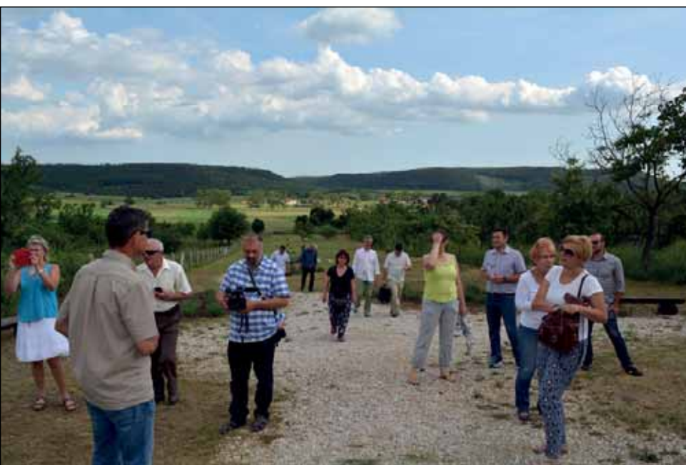
2017. Kisgyőr, út a Golgotához

Az elmúlt két évben gyakran felmerült a résztvevők részéről az az igény, hogy szeretnének ezután többször is találkozni, megbeszélni azt, ki hol tart, ha kell, egymástól tanácsot, segítséget kérni. A szakma nyelvén ez azt is jelentheti,