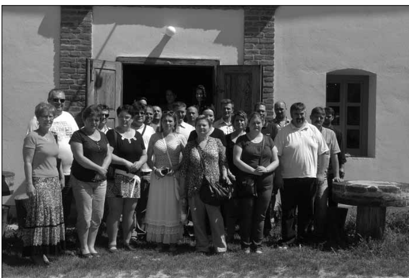
2015. Óriszentpéter, a Teleház előtt

A Nemzeti Művelődési Intézet jó gyakorlatnak tekint minden olyan szakmai kritériumoknak megfelelő innovatív folyamatot, módszert, cselekvést és eszközhasználat együttesét, mely a helyi közösségek aktivizálását segíti elő és a helyi érdekek megfogalmazására