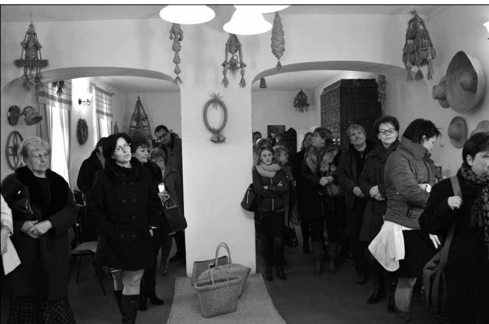
2016. Hajdúnánás Aranyszalma Alkotóház

melődött egy szűk réteg a fiatalok köréből, akik e mesterségbeli tudásukkal megalapozhatták jövőjüket, hiszen vállalkozókként számtalan értékmentő és értékteremtő megbízást kapnak a mai napig. Az elfeledett tudások átörökítését azóta a rendszeresen tartott kézműves foglalkozások keretében viszik tovább – leginkább a szalmafonást, a kosárfonást, a mézeskalács készítést, korongozást. A néprajzi táborok, aratónapok keretében a szőlőművelés, kézi aratás, marokszedés, kévekötés, cséplés, kettőzés, magtisztítás, kenyérsütés, sártapasztás, kerítésfonás, gyepű készítés mellett egyetemistáknak „Nagyapám ház” címmel mester-inas képzést tartanak rendszeresen. Az Oszkói Hegypásztor Kör Egyesület jó példaként szolgált arra, hogy egy nemes cél, a kulturális értékmentés és teremtés hogyan lehet alapja gazdaságfejlesztő folyamatoknak. Igazolja, hogy az elindított és egymásra épülő folyamatok gazdaságélénkítő hatása révén új perspektívát kínál az ott élők számára, munkalehetőséget teremt, és részbeni megélhetést biztosít helyben. Ha csak az osztálykirándulások fogadására vagy a „Vidéki élet” táborára gondolunk, mind-mind olyan kezdeményezések, mely folyamatosan új és újabb szolgáltatá-