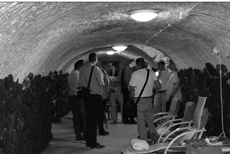
2017. Harsány, Sópince

sok kialakítását teszik szükségessé. A térségi együttműködés, mely az egymásra utaltságból, a források szűküléséből és abból a megközelítésből fakad, hogy többen sokra juthatnak, született meg a Klaszter létrehozását követően a Pannon Helyi Termék program. A programot 13 szervezet alapította, amelyhez megalakulása óta folyamatosan csatlakozhatnak vállalkozók, kistermelők és civil szervezetek, amennyiben vállalják a Pannon Helyi termék szellemiségét.