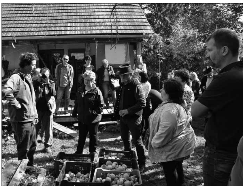
2017. Visnyeszéplak, gyümölcsfeldolgozó családi vállalkozás udvarán

udvarnok jó gyakorlatait is bemutató Somogy megyei tapasztalati látóút keretében jutott el 24 résztvevő, közöttük Vas, Győr-Sopron, Pest, Jász-Nagykun-Szolnok, Békés, Hajdú-Bihar megyei polgármesterek, közművelődési szakemberek, civil szervezetek képviselői és az Intézet megyei módszertani irodáiban dolgozó szakmai munkatársak. Visnyeszéplak a 90-es évekre eleredő és elnéptelenedő település volt. Amikor a budapesti Örökség Körből sokan úgy döntöttek, hogy egy élhetőbb, fenntarthatóbb életvitelt, a természettel való harmonikus együttélést szeretnének megvalósítani, és ezért élet és lakhelyként e falut választották, már csak harmincan, ha éltek itt az őslakosok közül. A megmaradás érdekében olyan feladatokat is el kellett vállalniuk a „beköltözőknek”, mint az útépités, szemétszállítás, vagy, hogy villany legyen. Ezért vált szükségessé egy jogi személy létrehozása, hogy ezeket a feladatokat hivatalosan is elláthassa. Így jött létre a Faluvédő Kulturális Egyesület, mely mindezek mellett a lassan elfeledett keresztény, népi hagyományok újraélesztésére, gyakorlására, ünnepek