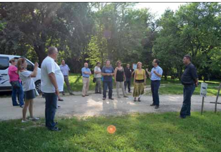
2014. Az oszkói Szőlőhegyen

E tekintetben tevékenységének legfontosabb szerepe a tudatformálás volt egy fölülről irányított rendszer kiépítésével, központi programok segítségével, az ehhez kapcsolódó technikákkal és eszközrendszerrel. Ideológiai célja is volt: „A mindenoldalúan képzett szocialista embertípus létrehozása” (sic!). Nem véletlen terjedt el szakmán belül az a humoros mondat, hogy „azé a nép, aki megműveli”- amely egyébként egy régebbi politikai szlogent „fordított át”-magának. Tagadhatatlan ugyanis, hogy ez a központosított kulturális hálózat komoly sikereket ért el mindaddig, amíg a hatalomnak szüksége volt rá, s a településeken a népművelő olyan népszerű ember volt, hogy a 80-as évek elejétől már érezhető folyamatos forráski-