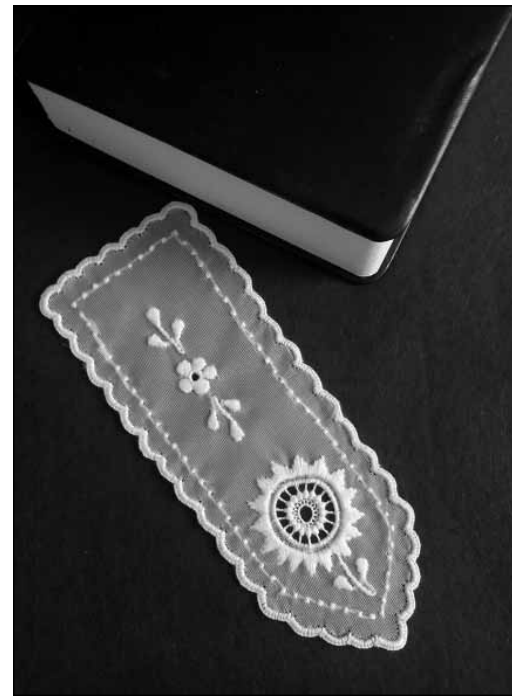
Höveji csipkés könyvjelző

Az elmúlt években Hövejen és számos más településen is rendszeresen tartottunk kézműves foglalkozásokat gyerekeknek. Több alkalommal szerveztünk kiállításokat,