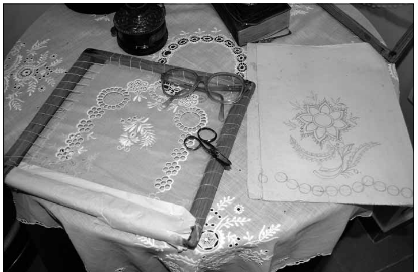
A höveji csipkevarrás kellékei

Múzeumpedagógiai foglalkozásokat is szerveztünk, amelyben szintén előkerültek a höveji csipkemotívumok: egy-egy feladatban megrajzolták ezeket vagy egyéb más technikákkal készítették el a virágmintákat.