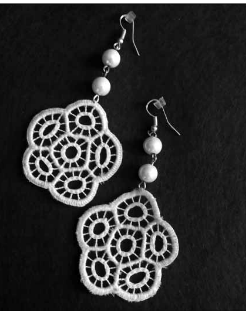
Höveji csipke fülbevaló