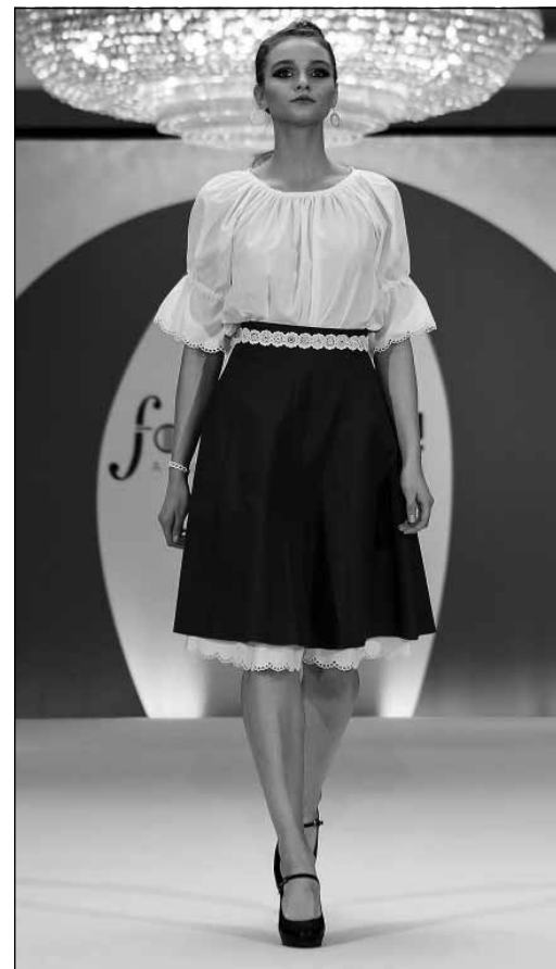
„A hagyomány a régi, a stílus új” címmel rendezett divatbemutatón

A höveji csipke meg tudta őrizni egyediségét. A sokszor megélhetést biztosító kézimunka a kezdetektől fogva a különlegességével hívta fel magára a figyelmet. Höveji helyi terméke napjainkban is egyértelműen az itt élők kulturális és gazdasági erőforrása, amely – szerepénél fogva – egyben összekötő kapocs, kiemelt kellék további újabb társadalmi, közösségi és gazdasági folyamatok generálásához is.