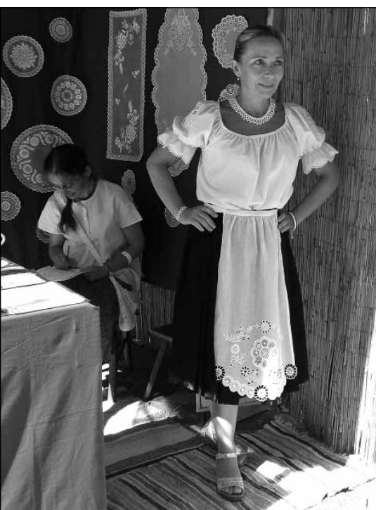
Höveji csipke blúzson és kötényen

ségük szorosabb, egységesen vannak egymásba kapcsolódva, ahogy távolodnak tőle, a különbség picit mindig nő közöttük. Ezek a motívumok, mint jelképek kifejezik a településen élők egységét, az itt működő közösségek sokszínűségét, magát a közösséget, a községet.