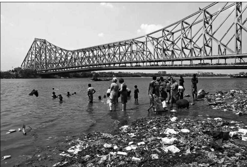
A természeti környezettel nem törődő gazdasági növekedés