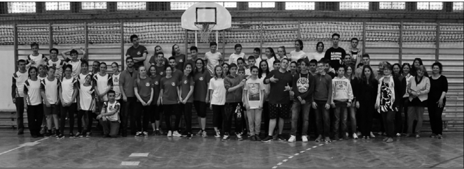
A verseny résztvevői

előadással, voltak, akik filmmel mutatták be településük nevezetességeit, történelmi és kulturális örökségét, vagy éppen az ott élők mindennapjait. A sorversenyekre – melyek között tavaly szerepelt zsákban futás, képkirakás, almákkal célba dobás, gördeszka és karton felhasználásával történő ladiképzés, bekötött szemmel való kislabdagyújtás és célba lövés – szintén mindenki maga hozta a játékötletét. Az eredményhirdetést követően az élményajándékok (torta, kalandpark-belépő, sárkányhajózás a Tatai tavon) kiosztása következett, melyekből minden csapat részesedett. Díszvendégünk, egyben a zsűri elnöke, Gábor Klára, a Komárom-Esztergom Megyei Népművészeti Egyesület vezetőjének tolmácsolásában ezzel is azt szerettük volna hangsúlyozni, hogy a játék örömeért, a részvételért és a közös élményért gyűltünk össze, nem a győzelem volt a fontos.