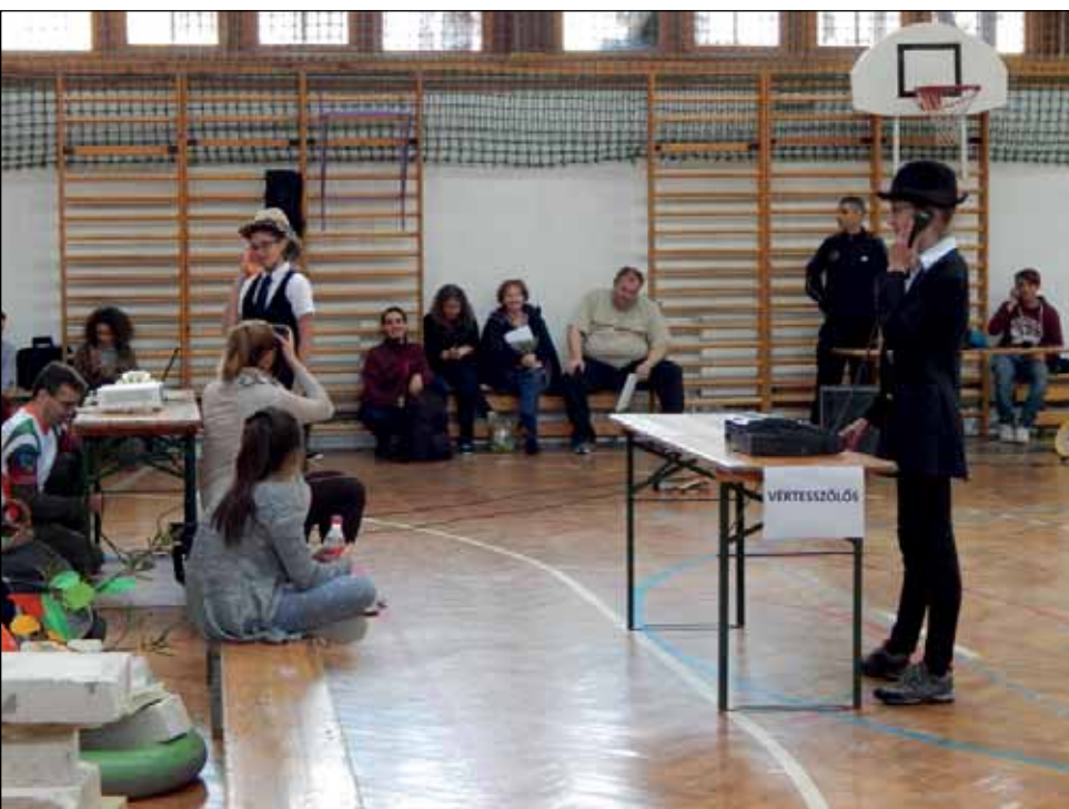
A vértesszőlősi csapat előadása

V. K.: Az IKSZT – mint a helyi csoportok tevékenységéhez helyszínt biztosító és a helyi események szervezésében közreműködő intézmény – munkatársaként úgy gondolom, a faluban jelentős