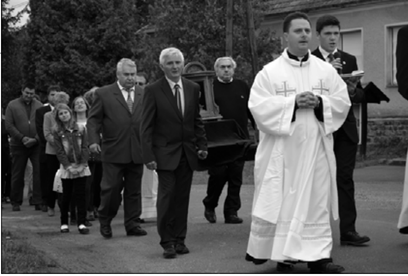
Körmenet Nagytilajon hegyháti közszereplőkkel