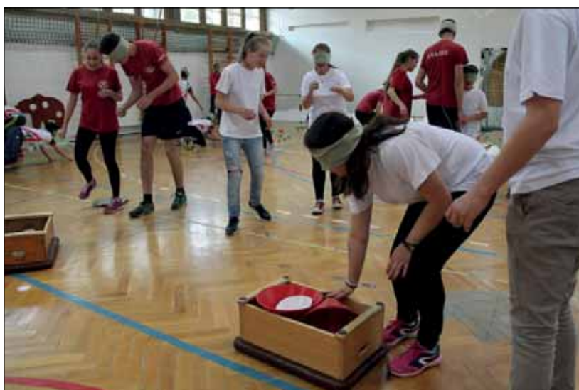
Játékgyűjtés bekötött szemmel