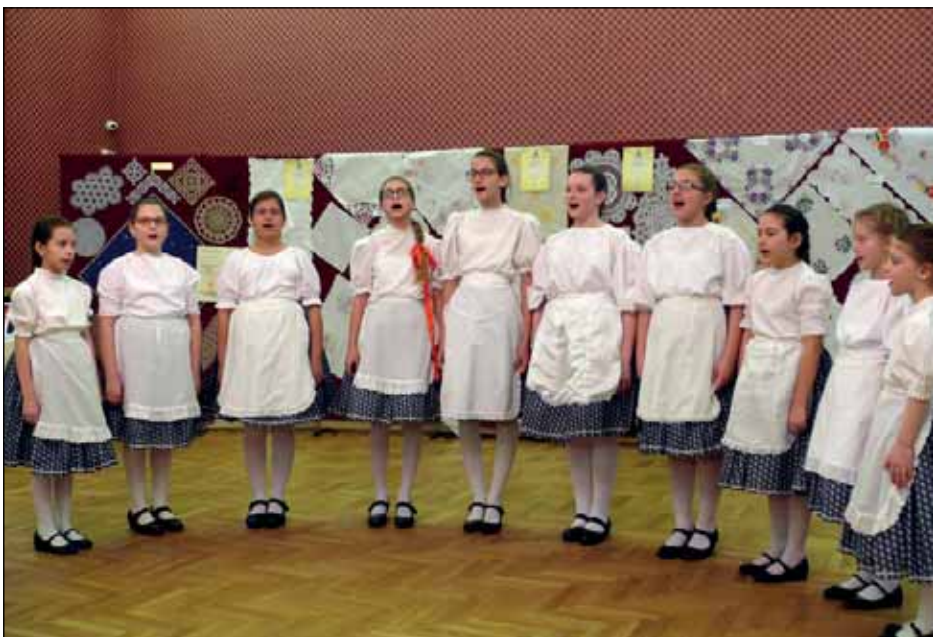
A horgosi Fülemüle lánykórus fellépése az Aranyszöm Rendezvényházban