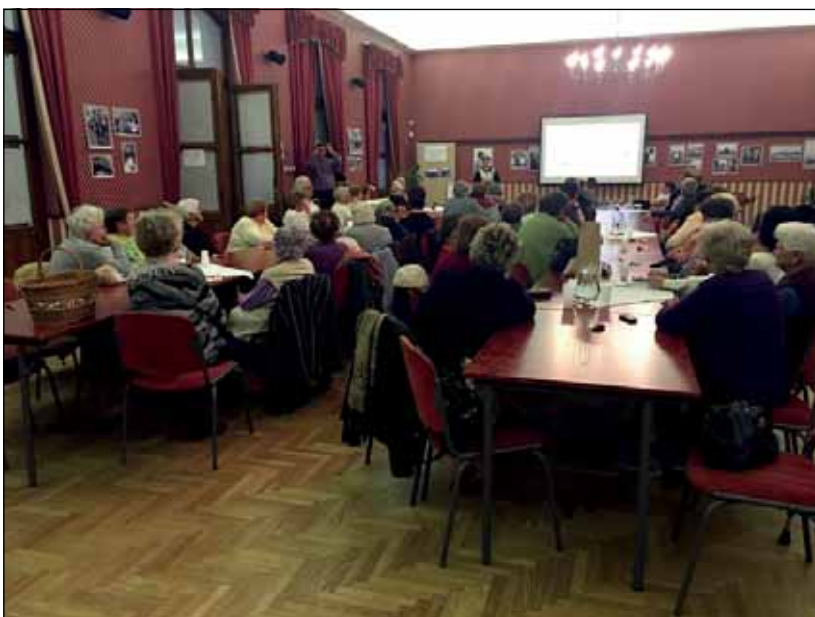
Horgosi Honismereti Szakkör tagjainak előadása

A fotókiállítással együtt öt település értéktárait is bemutattuk a hozzánk ellátogató helyi általános iskolásoknak.