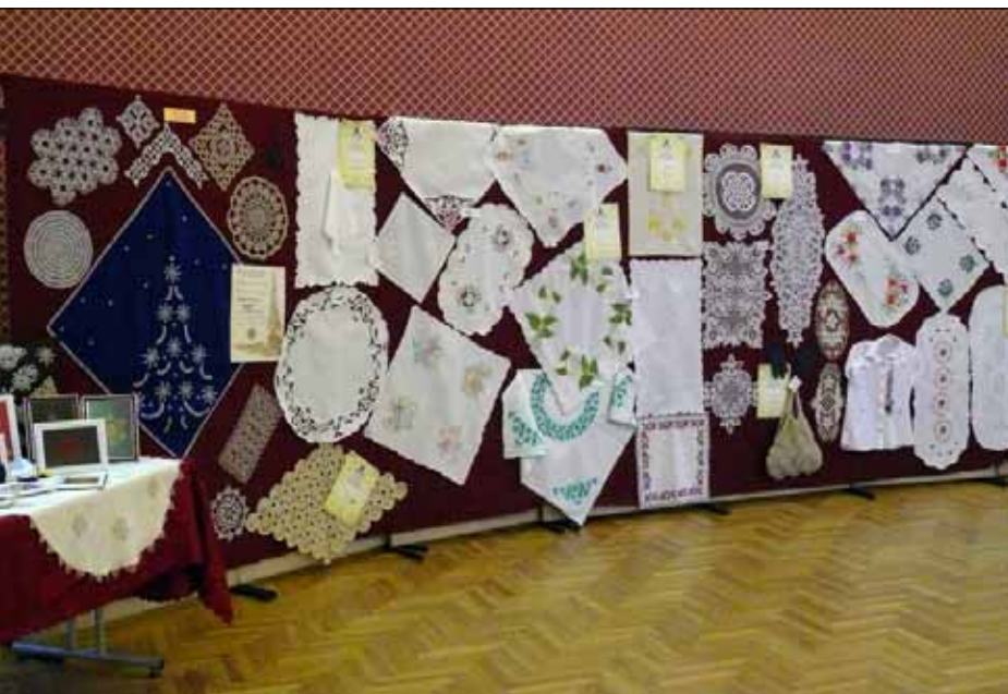
Magyar Kultúra Napja alkalmából a Magyararkanizsai Madeira Kézimunka Kör kiállítása az Aranyszöm Rendezvényházban (Mórahalom)

gyar Kultúra Napjáról, mely igazi közösségformáló rendezvénné nőtte ki magát. Magyararkanizsáról gyönyörű kézimunka kiállításnak, Horgosról és Királyhalomról – a fellépő gyerekeknek köszönhetően – nagyon színvonalas, népi kultúrát bemutató előadásnak lehettünk a részesei.