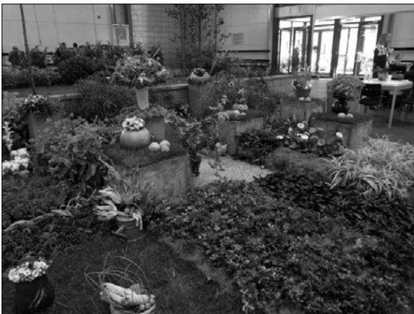
Látogatás az OMÉK-ra – a kiállítás egy részlete

a közös fejlesztések és programok számának növelése, az együttműködések konkrét, a helyi gazdaság számára is kézzelfogható eredményekkel járó fejlesztése. Ennek megfelelően a kapcsolatok aktivitása mellett cél azok eredményességének javítása is.