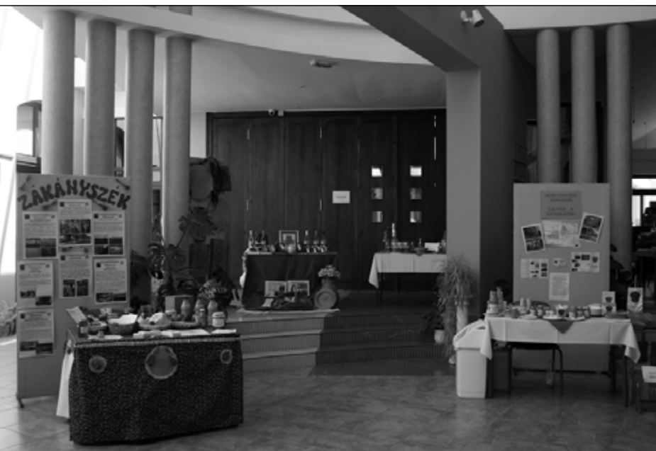
Értéktár konferencia, Aranyszöm Rendezvényház (2017. július 7.), Értéktárak kiállítása

2016-ban újabb kincsekkel bővült az értéktár: