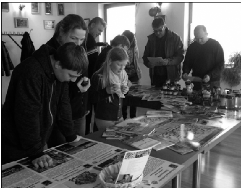
Kissor Ásotthalom külterületi része, tanyaközpontja. Ott található egy közösségi hely – Szent Gellért Közösségi Ház – itt volt a fenti 5 település értéktárainak kiállítása, kóstolóval egybekötve

Emellett folytatódnak az ismeretterjesztő előadások, hagyományőrző programokat indítunk, népfőiskolánk települései kulturális műsorok keretében mutatkoznak be. TOP-os keretek között Ismeret és tudásbővítő előadásokat is szervezünk, melyek több területet ölelnek fel – az igényeknek megfelelően.