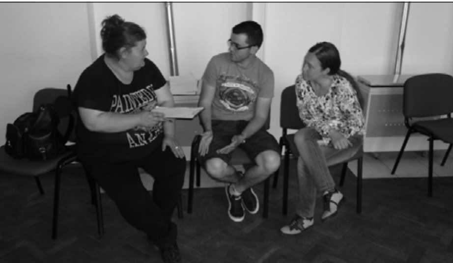
Közösségi tervezés Gersekaráton

tatási Programban. Őt az általa elvégzett munkáról kérdeztük.