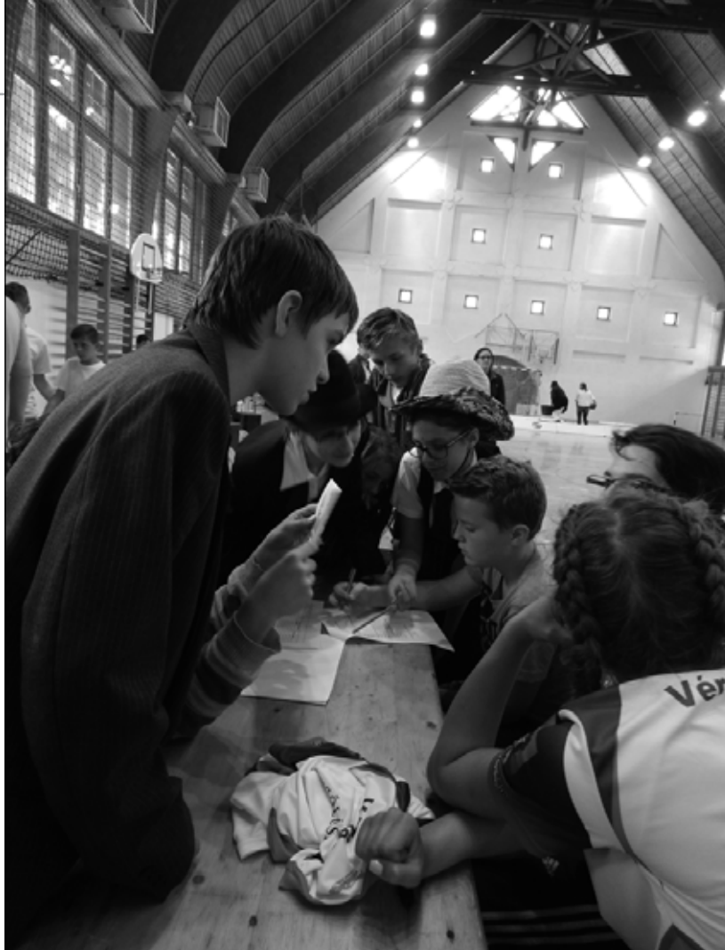
A totó megfejtése közben

bemutatásra a községben működő csoportok, intézmények és a lakosság bevonásával. A program-sorozat további elemeként szervezzük júliusra a hagyományörző, napközi jellegű nyári tábor, ahol az alsó tagozatos diákok ismerkedhetnek meg helyi hagyományokkal, történelemmel – többek között a németek betelepítésének történetével –, vehetnek részt élményórákon, múzeumlátogatáson vagy éppen helyi jellegű ételek elkészítésében, játszhatnak nyomkereső játékot, melynek során régi épületeket, tárgyakat kell majd megtalálniuk. A helytörténeti ismereteket olvasmányélményeken keresztül is szeretnénk bővíteni: Tóth Krisztina Ezer esztendő előtt című könyvének anyagát felhasználva egy, a tényleírások helyett mesébb, monda jellegű történeteket tartalmazó, helyi értékekhez kapcsolódó tematikus kiadvány megjelentetését tervezzük. Az em-