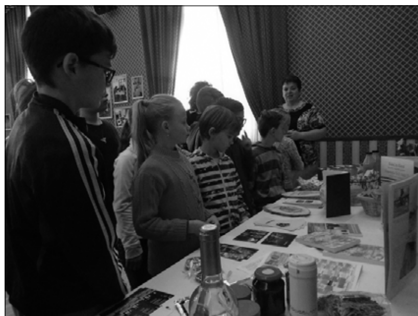
Ásotthalom, Mórahalom, Zákányszék, Röszeke, Domaszék értéktárait mutattuk be az Aranyzöm Rendezvényházban (Mórahalom)

Nagyon fontos minden területen a kapcsolatok erősítése, az előtűnk járók tapasztalatának, tudásának megismerése, az együttmű-