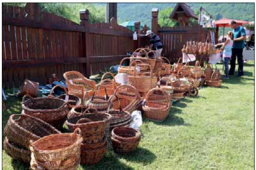
Kézműves kiállítás és vásár