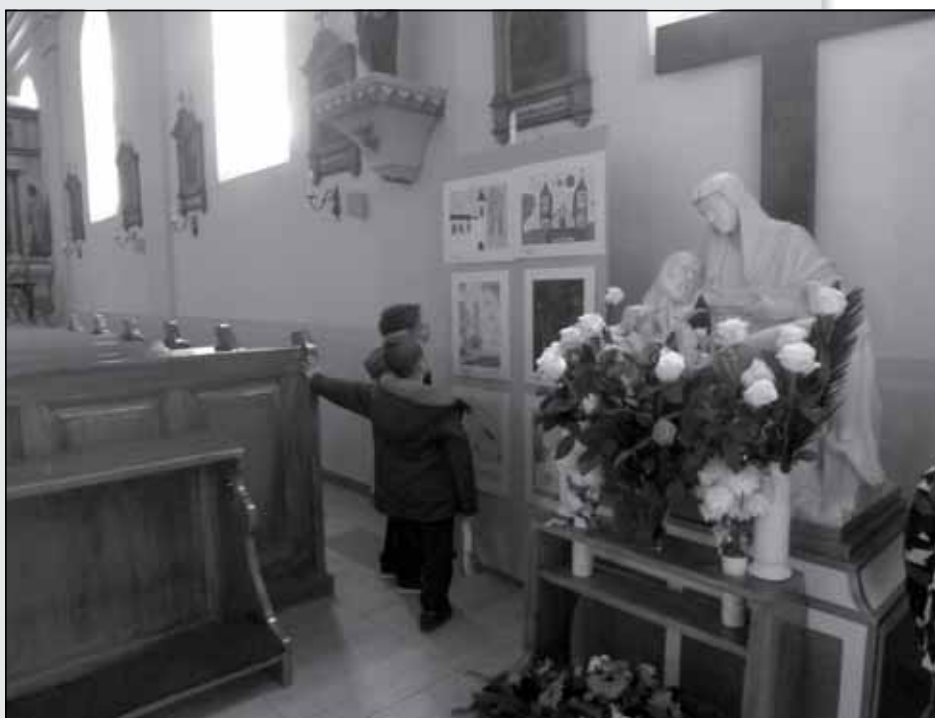
Az én templomom c. rajzverseny díjazott munkáinak kiállítása a Szent László templomban

Szent László Katolikus Általános Iskola, Mórhalom