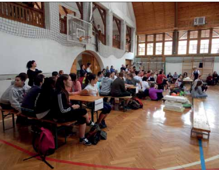
A közönség soraiban