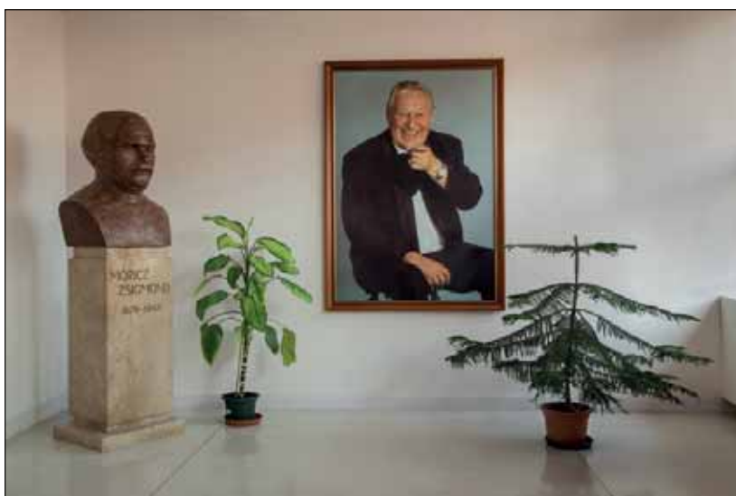
Bessenyei Ferenc Művelődési Központ, Hódmezővásárhely

De ettől függetlenül azt gondolom, hogy a képekből nem feltét-