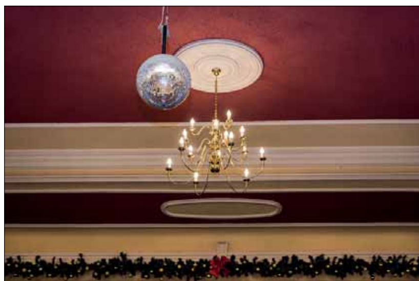
Kőbányai Gyermek és Ifjúsági Szabadidő Központ, Budapest