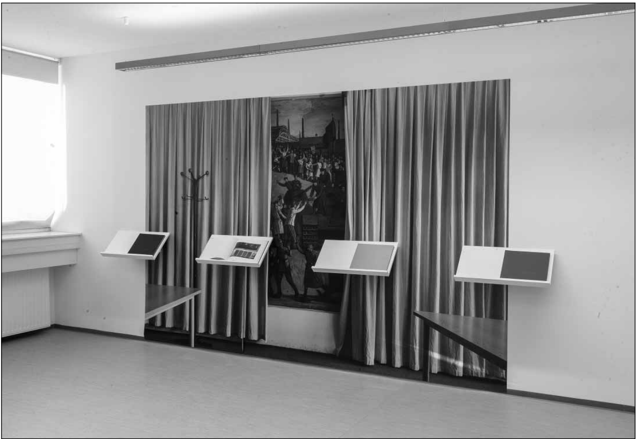
Diploma installáció

is építészeti megközelítés, hanem az atmoszféráját próbáltam átadni ezeknek a helyeknek.