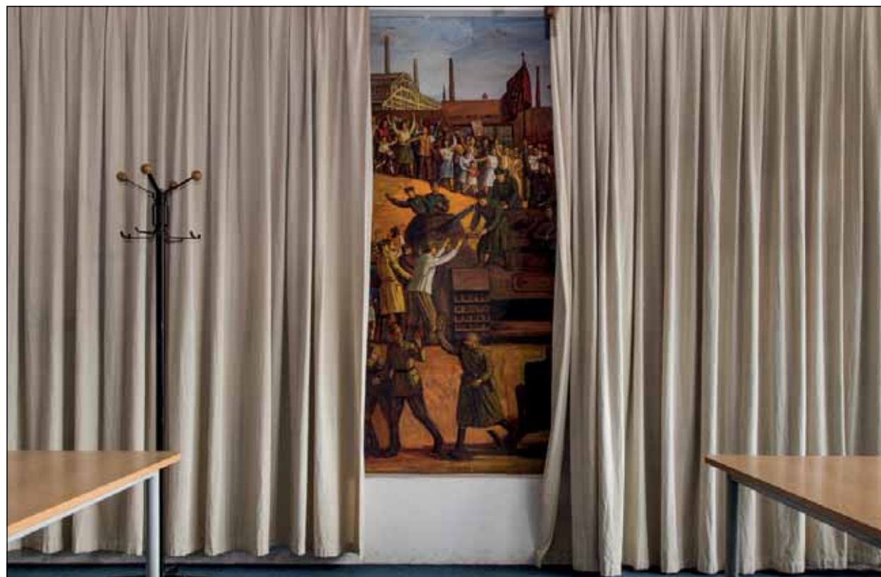
Csepeli Munkásotthon, Budapest

Borsod-Abaúj-Zemplén megyében, a harmadik Veszprém megyében található –, hogy mind a három szakszervezeti fenntartásban működött korábban. Később mind a három intézmény mögül eltűnt a fenntartó szerv, és az önkormányzat vette át őket. Mind a három intézmény körülbelül megépítése óta változatlanul áll. Egy-két bútorcsere, vagy egy kis festés volt, de egyébként nagyjából minden ugyanaz, valamint mind a három egy kisebb településnek az intézménye. Arról beszélgettünk az interjúk során az odajárókkal – különböző korosztályokkal készítettem az interjúkat –, hogy mi az oka annak szerintük, hogy ezek a helyek nem változnak, illetve milyen érzelmi kötődésük van ezekhez a helyekhez. Tetszik-e nekik mint épület, szerintük miért azok a festmények vannak a falon, amik stb. Az derült ki számomra, hogy nagyon visszás helyzet ez, mert például a műcsónyi művelődési ház épülete műemlék. Nagyon kevés épület kaphatott műemléki védel-