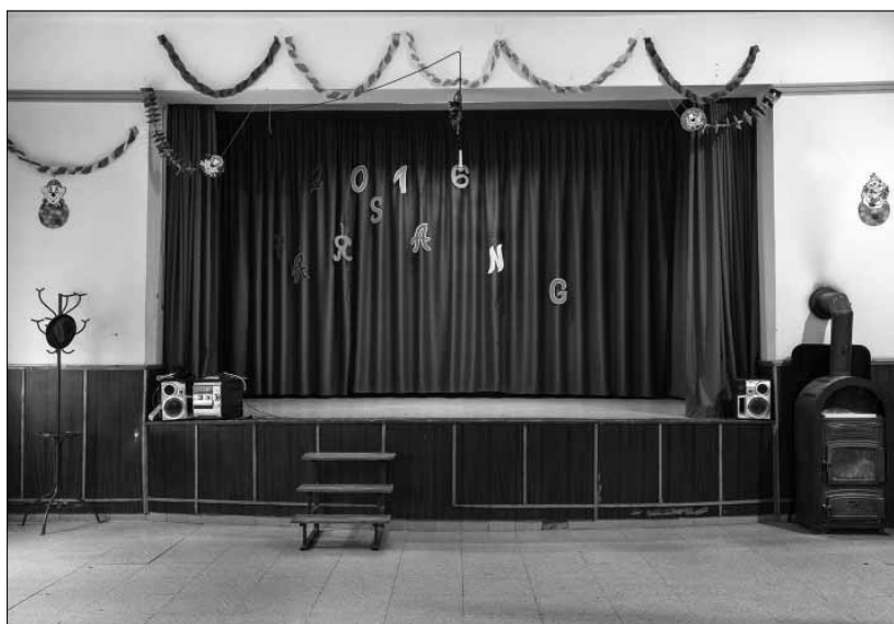
Művelődési Ház, Aka

Speciális kötetzeti megoldással készült el a könyvem, jelenleg négy példányban, úgy, hogy a fotókat felhajtva meg lehet nézni, hogy mikor és hol készült az adott kép. Az interjúkat és mindazt, amit összegyűjtöttem a kutatás alatt, egy kis füzet formájában sikerült belekötöni a könyvbe, úgyhogy ilyen formában prezentáltam a kiállításon. Az egyetemen egy hatalmas fotóval, pont a csepeli munkásotthonnak a felolvasó termében készült és életnagyságban kinagyított képével installáltam a könyveket – és ott, mint egy kis olvasósarokban, lehetett a képeket böngészni.