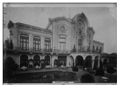
A budapesti Nemzeti Kaszinó közösségi termei

FÓNAGY ZOLTÁN az MTA BTK Történettudományi Intézetének tudományos főmunkatársa. Kutatási területe a XIX. századi magyar történelem, különösen annak társadalom- és művelődéstörténeti vonatkozásai. Több magyar történeti, művelődéstörténeti összefoglaló kézikönyv XIX. századi fejezetének szerzője. Életrajzot és több tanulmányt is írt Széchenyi Istvánról.