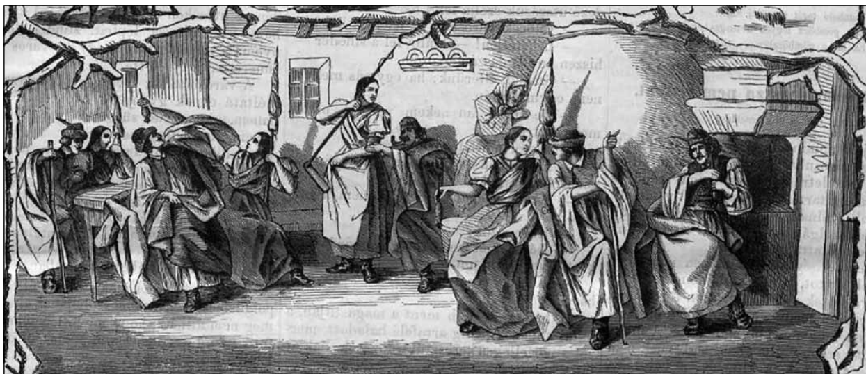
Fonó ábrázolása a Vasárnapi Újságban, 1867

katekerstéggel fogalmazhatok úgy is, hogy a fonó egyúttal a közösség önreprodukciójának, azaz a párválasztásnak is az egyik legfontosabb intézménye volt.