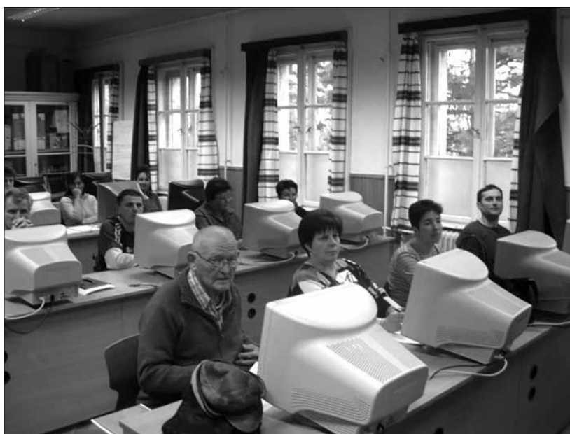
A Jávorka szakközépiskolában működtek az alapfokú számítógép-kezelő tanfolyamok (több mint 20-at szerveztek)

2004-től önálló irodát béreltünk, s ott folyt a szervezési és adminisztrációs munka. Nevezetes még a 2004-es év azért is, mert ekkor volt az első „hely szelleme”