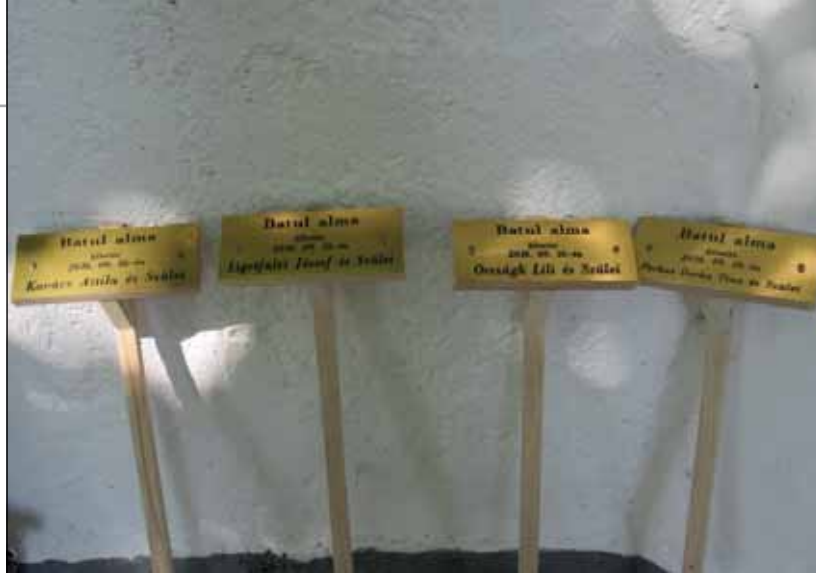
Egy fa, egy gyermek

Jelenleg a településen működik az Őszirozsa Nyugdijas Klub, ezen belül énekkar, valamint a település közbiztonsága érdekében a Polgárőr Egyesület.