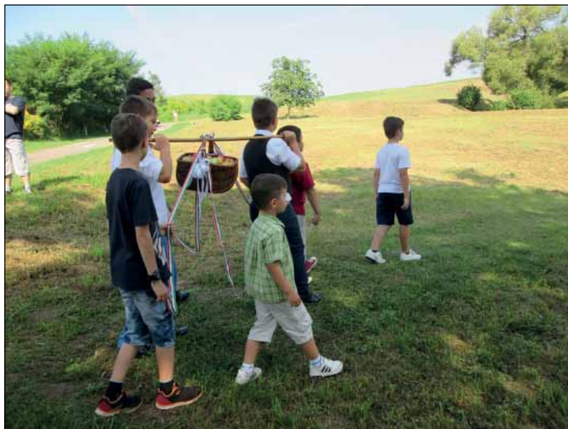
Irány az almáskert