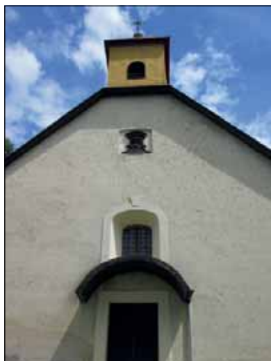
A szerviták temploma

kig, majd a kis erek egyesülnek és a községen keresztül csörgedezik kisebb-nagyobb vízhozammal, befogadjához, az Eger-patakhoz. A patak neve korábban Mónospatak volt, utalva arra, hogy fontos energiahordozóként vízimalmokat, darálókat, kendertöröket hajtott. Sajnos a II. világháború után a régi malmok sorra megszűntek.