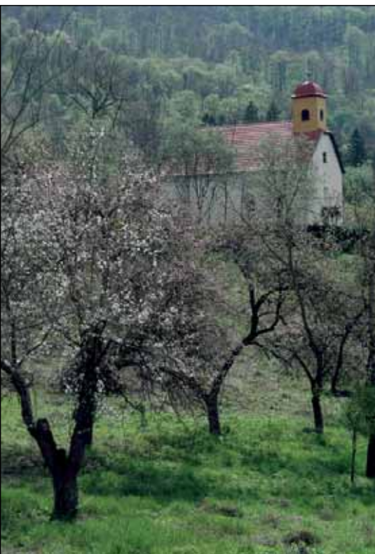
Az almáskert tavasszal