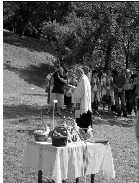
A fák megszentelése

Értelemszerűen szeretnénk a kert hírnevét továbbvinni, minél szélesebb körben terjeszteni, ezért jövőre terveim között szerepel a Batul Fesztiválra meghívni a településünkről elszármazottakat, és nekik is bemutatni a megörökölt értékünket.