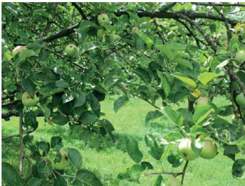
Érik az alma