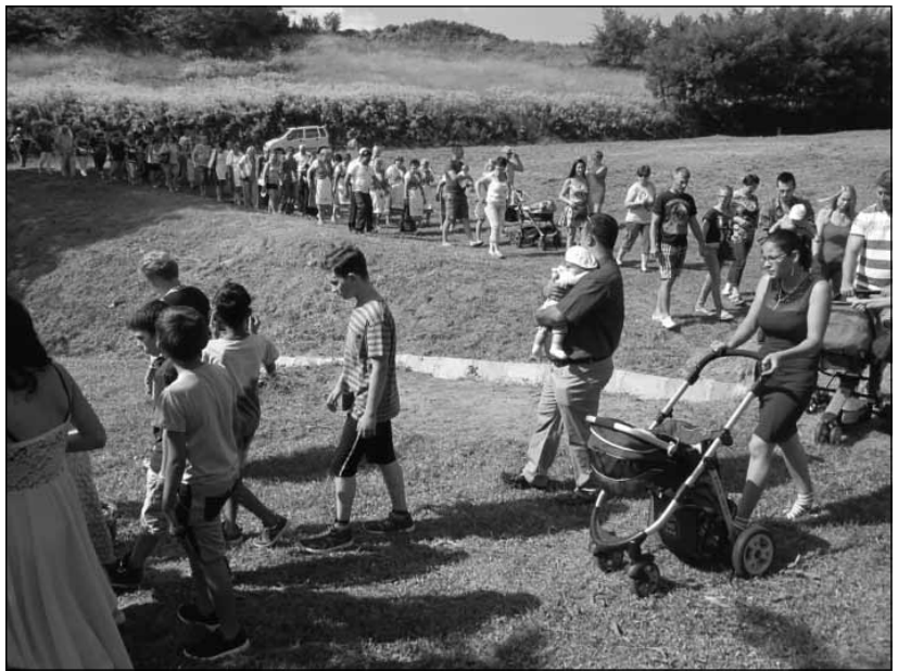
Mindenki kíváncsi az ültetésre

K. É.: Mit gondol, az elültetett fák növelik a településhez való kö-