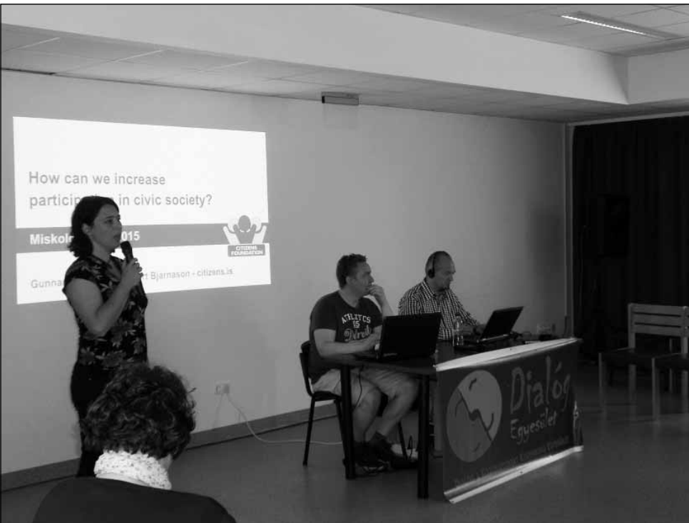
Képzés, Miskolc

őket a település jövőjének tervezésébe. Így interneten keresztül tulajdonképpen mindenkit el tudunk érni. Nem egyszerűen egy ötletadó és szavazó felületről van szó, hanem elengedhetetlen, hogy az ötletgazdák érveljenek is felvetéseik, elgondolásaik mellett. A Citizens Foundation volt tehát az egyik partner, akik biztosították a szoftvert, a felületet, a lehetőséget és itt is voltak Magyarországon. Bemutatták, és adták a tudást egy ehhez kapcsolódó képzésen keresztül. Partnereinknek tekintjük továbbá azokat a településeket és LEADER közösségeket, akikkel együtt dolgoztunk. Ez egy kísérleti program, melyet a projekt során folyamatosan hangsúlyoztunk is.