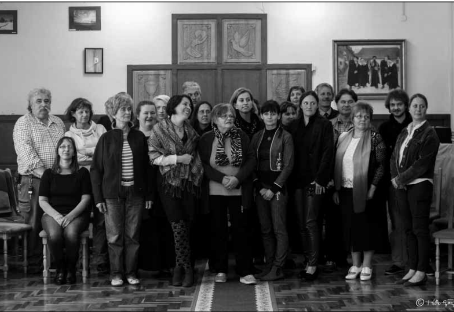
Megyei műhely, Arnót

Ózdi kistérséget öleli föl, az egyesület elnöke annak a településnek a polgármestere, ahol éveken keresztül közösségfejlesztési folyamat zajlott. Miskolcon az Avas városrészben hat éve jelen van a Dialóg Egyesület, ami azt jelenti, hogy a közösségfejlesztésről itt is van tudás. Az volt a feltevésünk, hogy kell, hogy legyen közösségfejlesztési folyamat, ami megelőzte ezt a projektet. Végül mégsem sikerült minden esetben közösségfejlesztési előzményekkel rendelkező településre mennünk, hanem ott kezdtünk el dolgozni, ahol volt döntéshozói nyitottság. Ami persze önmagában még nem elég. Felkészült lakosság is kell az eredményekhez.