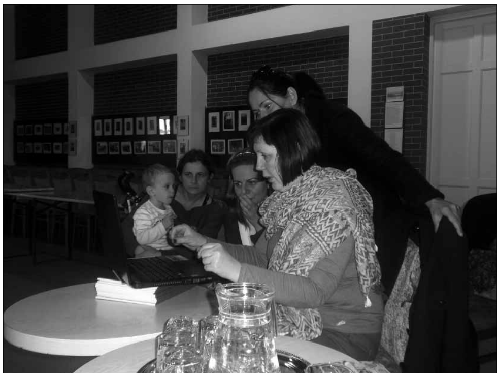
Terepmunka, Kistokaj

M. A.: Én a közösségi tervezést a közösségfejlesztési folyamat egy módszerének, eszközének tekintem. A közösségi tervezésnek több hozadéka is van egy település, térség életében. Az egyik, hogy bevonjuk az embereket, hogy megszólítsuk, hogy elkötelezzük őket. Emellett a módszer fontos szerepet tölt be a rendszeres közösségi beszélgetések során is, amelyeken egyben a tervezések is zajlanak. Ennek eredményeként lesz egy jó tervünk, és ha ezt a tervet együtt akarjuk megvalósítani, lesz hozzá egy