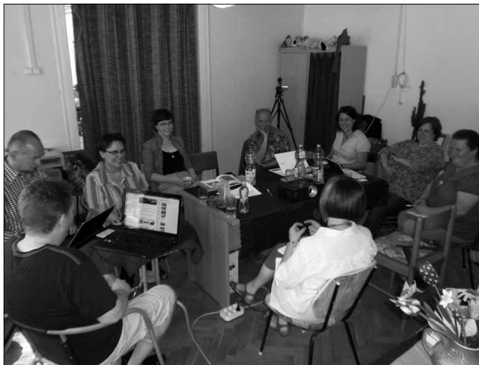
Szakmai képzés, Miskolc

ben. Ez abból állt, hogy minden terep kapott egy segítő, fejlesztő szakembert, akinek a jelenlétével, a támogatásával elindult a közösségi tervezési folyamat a terepeken, és itt az volt a szerepünk, hogy a helyi aktív csapatot segítsük, hogy végig tudják vinni a folyamatot. Fontos, hogy mindenhol