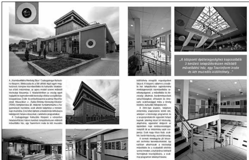
A „Környékünk Művelődési Központja” Szegeden. A képen látható az épület külső része, amely a városi környezetbe illeszkedik. Az épület modern, funkcionális és kényelmes, az Agora központjának céljait szolgálja. A képen látható az épület külső része, amely a városi környezetbe illeszkedik. Az épület modern, funkcionális és kényelmes, az Agora központjának céljait szolgálja.