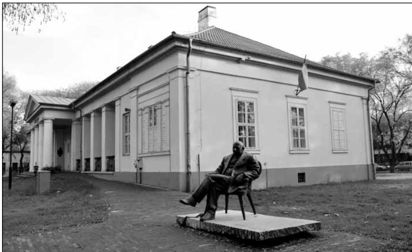
A karcagi Györffy István Nagykun Múzeum, névadója szobrával