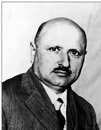
Györfy István (1884–1939)

„... a történeti forrásvizsgálat nyomán szinte az elhalványult, a közösség nagy részében már akár el is felejtett emlékeket képes lehet a kutató előhívni.”