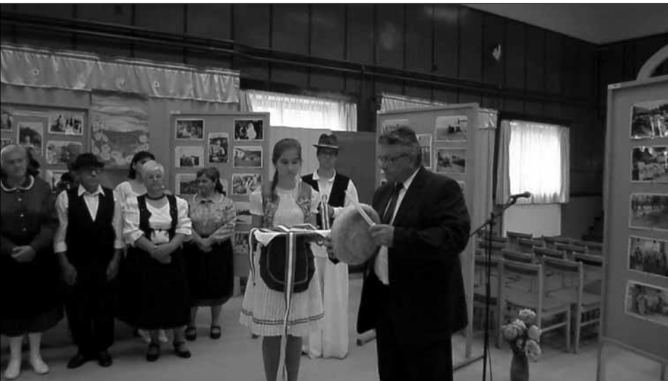
Augusztus 20., Szent István-ünnep

D. G.: A helyi vállalkozások (Zentis, Globál-Vép. Kft. stb.), üzletek és az önkormányzat összesen 200-250 főt tudnak foglalkoztatni. 10%-os munkanélküliség van Drégelypalánkon, a jelentős része a helybeli roma lakosságból tevődik össze, sajnos nagy részük képzetlen. A munkaképes cigányság közel 95%-a nem dolgozik. Közmunka keretében évente olyan 50-60 embert tud foglalkoztatni az önkormányzat: 2-3 havi turnusváltásban 15-20 fő dolgozik. A falu közterületeinek gondozásában ez nagy segítséget jelent. Új elem a Kulturális Közfoglalkoztatási Program a Nemzeti Művelődési Intézet szervezésében, melyhez Drégelypalánk is csatlakozott.