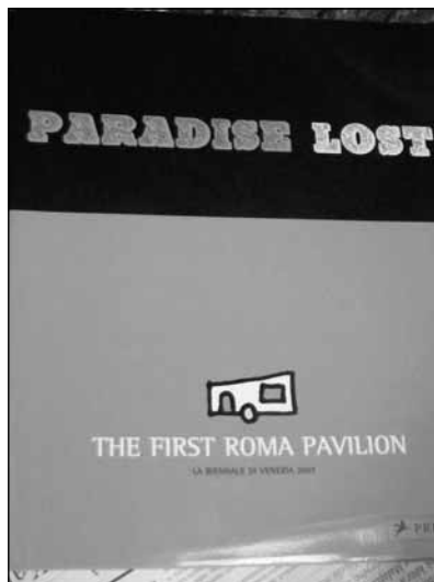
A 2007-es Velencei Biennálé katalógusa

Sajátos akusztikájú lesz ez a kitüntetett Roma pavilon attól, hogy a The New York Times-ban Michael Kimmelman nagy írásban leplezi le a Magyar Nemzeti Galéria roma kiállításának álságait. Cikkéről – Ölelés helyett művészeti tárlat a romáknak – a Népszabadság számol be február 6-án. „A kiállítás 'zürzavar' volt, annak viszont jelképes. A kiállítás bolhapiac-hoz hasonlított, jórészt csapnivaló, autodidakta művészek alkotásaival. A roma művek hosszú, zsidbasztó sorát talán a metafora kedvéért helyezték el a padlásteri galériákba, mintegy száműzve őket az alsóbb szintek pompás termeiből.”