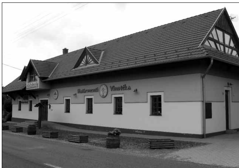
Az egykori sarki kocsmá – ma közösségi ház