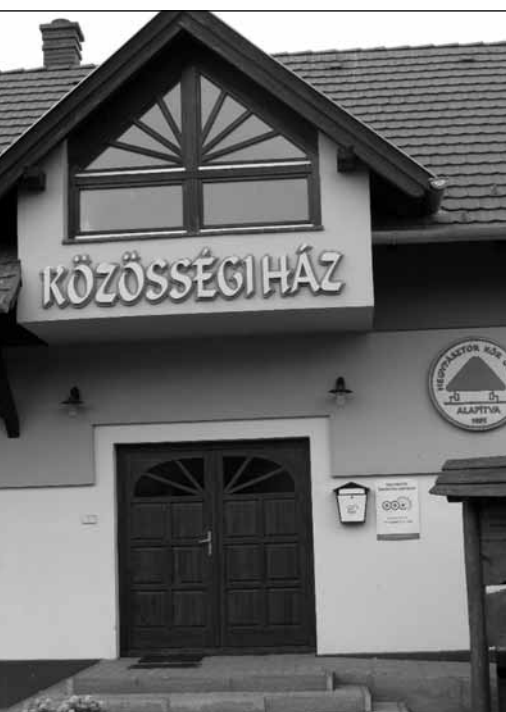
A Hegypásztor Kör közösségi háza