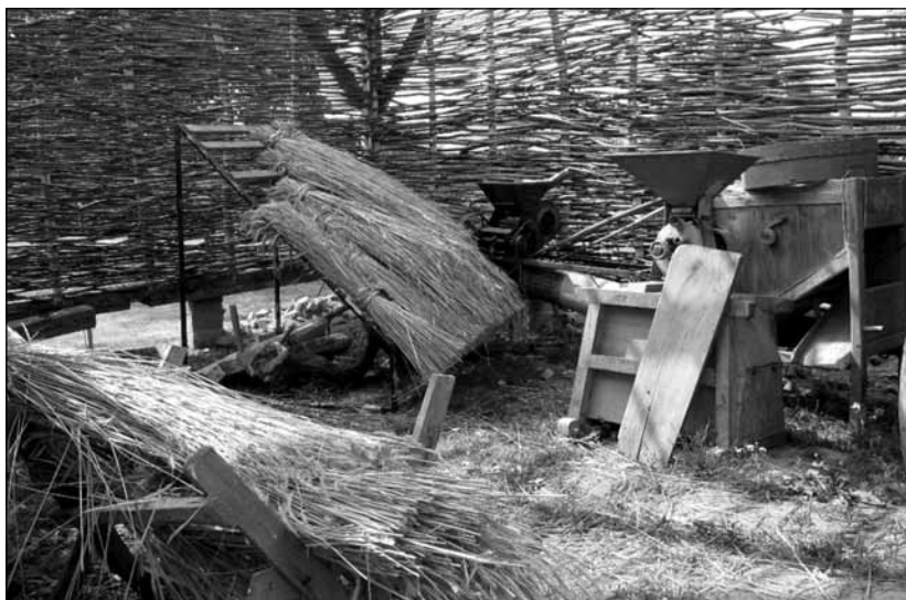
A fészer és eszközök

Pesten, az egyetemhez kapcsolódva vannak olyan körök, melynek tagjai helykeresőknek nevezik magukat. A helykeresők azon vannak, hogy egy ideális közösségi összetételt alkossanak meg, legyen benne agrármérnök, állatorvos, és minden, amire még szükség van egy jól működő faluközösséghez. Aztán megkeresik az a helyet, ahol ezt a közösséget megvalósíthatják: birtokba veszik és leköltöznek, gazdálkodnak, önálló életet folytatnak. Azt a kérdést tettem fel, hogy miért nem a kiüresedő falut választják? Ők maguk mondták, hogy talán azért, mert akkor túl nagy lenne az alkalmazkodási kényszer, köszönhetően a közösségeket érintő változásoknak: ma már jellemzőbb a szigetszerűség igénye ezekben a közösségekben is. Az egésznek a csattanójaként a mellette ülő lány megjegyezte, hogy a bátyja is jár egy ilyen körbe, néha ő is el szokott menni vele, aztán rácsodálkoztak, hogy eddig nem tudtak egymás helykereső társaságáról, és felvetődött a gondolata annak, hogy hozzák össze a két társaságot, mert együtt talán többre mennek.