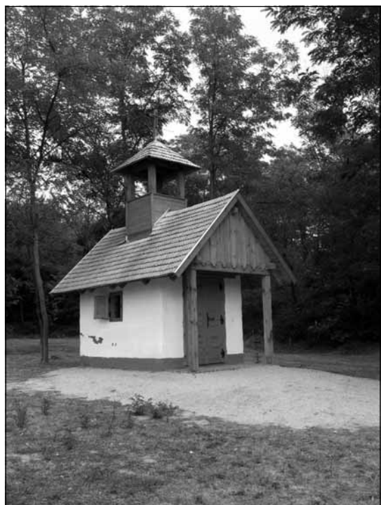
A kápolna közelről – a kézművesség remeke

K. I.: Ezen a beszélgetésen történt, hogy egyik fiatal arról mesélt, hogy