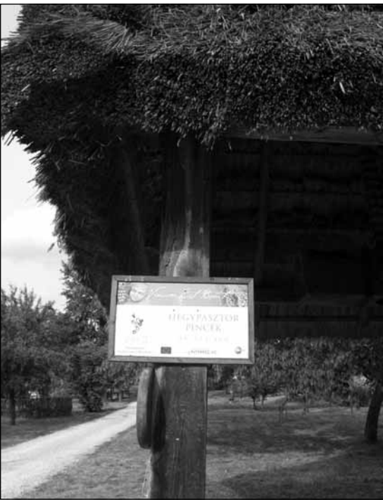
A Hegypásztor Kör birtokának bejárata

és a térség volt a főhazánk. Egyrészt ez volt a nagy felismerések korszaka: az értékmérés mellett sokkal inkább a közösségi alapú irányokra kezdtünk ráébredni. Olyan stratégiai összefüggések kristályosodtak ki, melyekből sok szempontból ma is építkezünk. Ez az időszak kezdődött azzal, hogy ha ránk hagyták eleink azt a célt, hogy mentsük meg a pincéket, akkor mentsük meg a pincéket! Erre a célra pályázatokat adtunk be, s mellette feltérképeztük, hogy milyen pincék vannak még, amelyet érdemes lenne megmenteni az enyészettől. A felújításokra addigi viszonylatokban sok pénzt, több millió forintot nyertünk. A tulajdonosoknak, akikkel egyeztetünk, még önrészt sem kellett vállalniuk, csak hozzájárulniuk, hogy mi újraszuppoljuk, – több esetben szinte az alapoktól újraépítsük – a pincéjét. Valahol ennek hatására indult el a másik nagy törekvésünk, hogy a fiatalokat próbáljuk meg helyben tartani. Tudatos csapatépítő akciókon számos dolog beindult: új generációkat vontunk be a közösségi életbe, akkor indult el a teleház, akkoriban kezdte el működését egy pályázat révén a zsúpkészítő műhely. A műhely biztosította a tudást a pincék megmentéséhez: ezek a folyamatok párhuzamosan folytak.