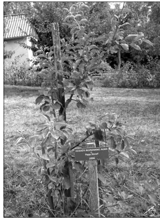
Őshonos facsemete az örökbefogadó nevével

Ez a „kocsi megelőzi a lovat effektus”: lehet, hogy nagyon hasznos az, amit teszünk, mert sok ember érzi a hasznát; de azt is látjuk, hogy viszályabb is kell lépnünk, hogy ennek az alapjai is meglegyenek. Ennek jegyében tervezünk egy helyi termék kézműves inkubátor központot. '85-ben megtanultunk zsúpot készíteni és pár éve bekerültünk egy közép-európai programba, ami a szellemi kulturális örökség tőkésítéséről szól. Azt tapasztaljuk, hogy az Európai Unió és az Unesco 2004-2005 óta kimondottan azt akarja létrehozni vagy módszertanilag beágyazni a programba, amit 1985 és 2005 között véghezvitünk. Ezek nagyon biztató visszajelzések, és kíváncsian várom, hogyan tu-