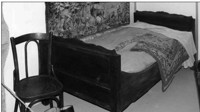
Tiszta szoba, az ágyban eredeti szalmazsák van

Nos konyhai eszközökről, edényekről van szó, ám mint minden magyar szólás, közmondás, mélyebb értelmet hordoz. A cserépfazék mindig idősebb edénye volt a konyhának, mint a csupor, így ezzel a mondással fejezték ki a régiek, hogy adjunk helyet az idősebbeknek. Bölcsességben, tudásban, a falusi élet gyakorlatából van még mit elsajátítanunk. Erre világított rá a kiállítás, mely megrendezésre a Megyei Művelődési és Ifjúsági Központban került, Zalaegerszegen, 2006. Márton napján.