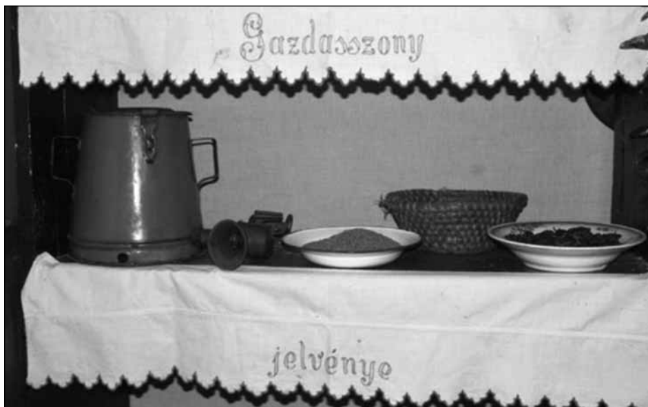
Stelázi (kamrai polc) részlete hímzett stelázscsíkkal

Különös és megható hangulata volt a kiállításnak a szlovéniai lendvai bemutató alkalmával, hiszen a Muravidéken valaha a len és kendertermesztés messze földön híres volt. Hagyományainkhoz híven a kiállítás kísérő momentuma volt a népies ételek megismertetése. A látogatók minden alkalommal megismerkedhettek a kiállítás-megnyitón felszolgált népi ételek elkészítési módjával is. Csak néhányat felidézve, a ludaskása, libazsíros kenyér lilahagymával, a „kótt rétes”, a grillázskészítés, a csörögefánk, az angyalbögyölő, a csicskenyetea, a bodzaszörp készítés, a fumu, a mézeskalácskészítés. A kiállítás a 2007. novemberi Zalaegerszegi kiállítás után – Keresztury Dezső ÁMK (volt MMIK) – került 2008. augusztus 20-án Szlovéniába, Lendvára, s mutatták be a Magyar Nemzetiségi Művelődési Intézet szervezésében a lendvai zsinagógában.