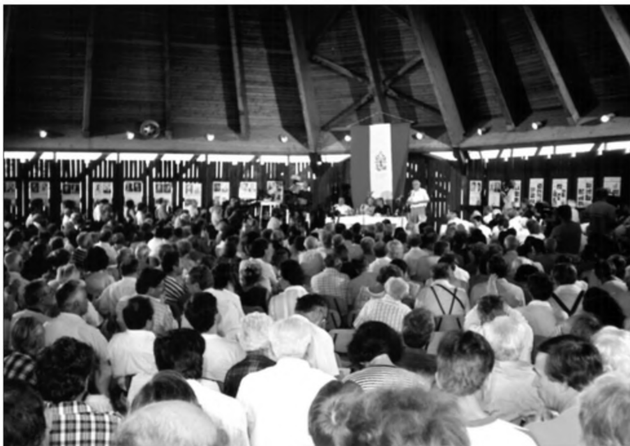
Szárszó 1993 Konferencia

1941-ben, a harmadik, faji zsidótörvény életbe lépése után megjelentette Bary József, a tiszzaeszlári per vizsgálóbírójának emlékiratait, amelyek szerint