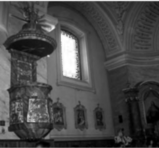
Szent Anna templom

nek, nem szívlelnék. Abból akár lehet gyengébb osztályzatuk is. De a tudás a lényeg. Két gyerek, két különböző mentalitás. A fiam az nagyon jó fejű gyerek, de laza. Ami érdekli, azt tudja, ami meg nem érdekli, azt nagy nehezen megtanulja négyesre. A kislány egy maximalista, ő negyedikes. Neki mindentől mindent kell tudnia. Szerintem nem lesz gond velük. Itt áll előttük a nagy lehetőség, Kárpát-medencében bárhol tudnak majd továbbtanulni, munkába állni. A magyar történelem, a magyarság eredete – érdekes témák és otthon vannak benne.