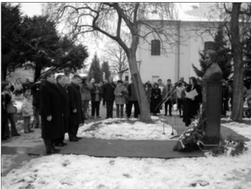
Az első délvidéki Petőfi szobor avatása március 15-én, a Művelődési Egyesület 60. születésnapján

Sőt az idén a Rákóczi Szövetség programjába is belekerültünk, ők is egy kis csomagot adtak a gyerekeknek, akik úgy mondták, hogy magyar iskolába iratkoznak. Illetve szeptemberben 10 ezer forintot fognak kapni ösztöndíjként, aki magyarba iratkozott. A Magyar Nemzeti Tanácstól egy szép tanszer csomagot kapnak. Valami úton-módon ez is inspirálja őket. A napokban olvastam, hogy a 22 ezer forint helyett csak 15 vagy 17 ezer forint lesz a támogatás, az eljárás miatt Magyarországra felé. Ilyen tételen csökkenteni, hogy határon túli magyar gyerekek nem kapják meg azt a támogatást. Állítólag, hogy majd megszűnik az eljárás, mások lesznek a feltételek, a különbözetet év végéig meg fogják kapni. Ez rossz húzás volt. Annnyit nem spórolnak rajta, nekünk meg tényleg sokat jelent, hogy