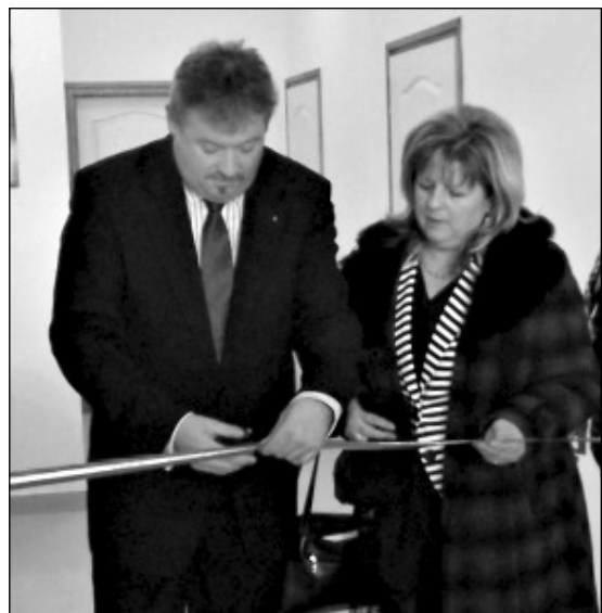
Az IKSZT átadása

Ha a helyi termelést a feldolgozással is összekötik, még több pénzt lehet helyben tartani, és nem kell elutazni