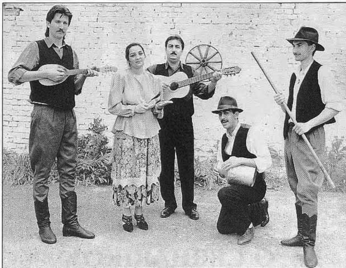
A NAGYECSEDI FIATALOKBÓL 1985-BEN ALAKULT EGYÜTTES