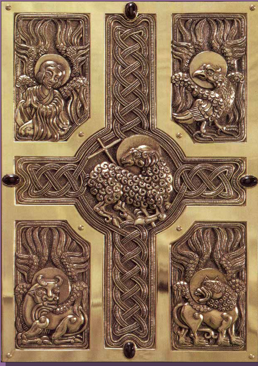
A Szent II. János Pál pápának készített misekönyv eleje, Vatikán, 1991. (Ozsvári Csaba)