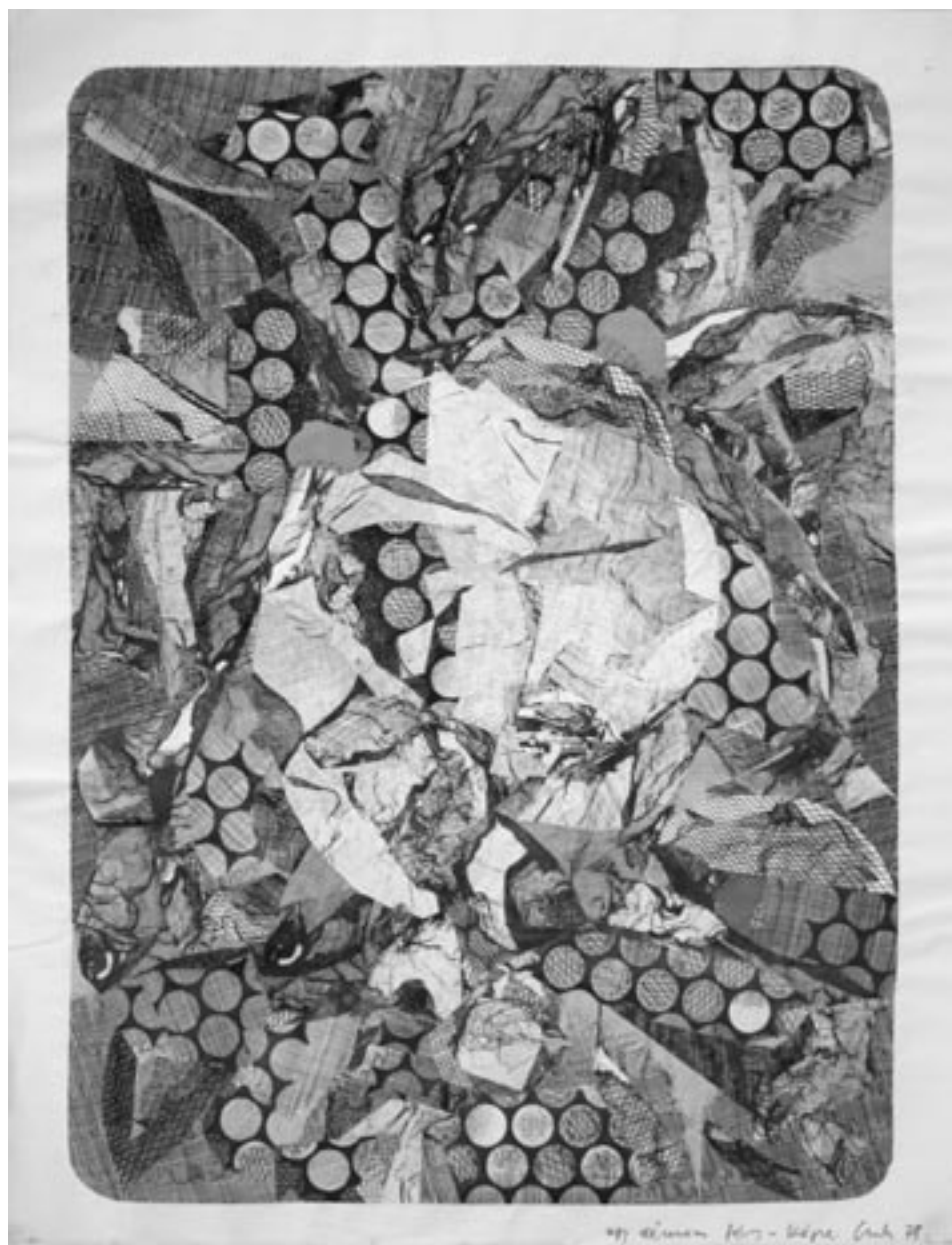
Csorba Simon László: Egy démon fény-képe kollázs, 65x50 cm, 1978