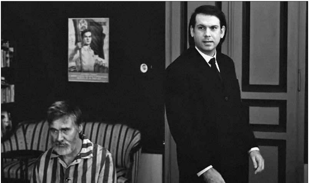
Jelenet a Ti is élni fogtok című filmből.