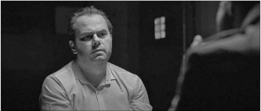
Jelenet a Koronatanú című filmből.