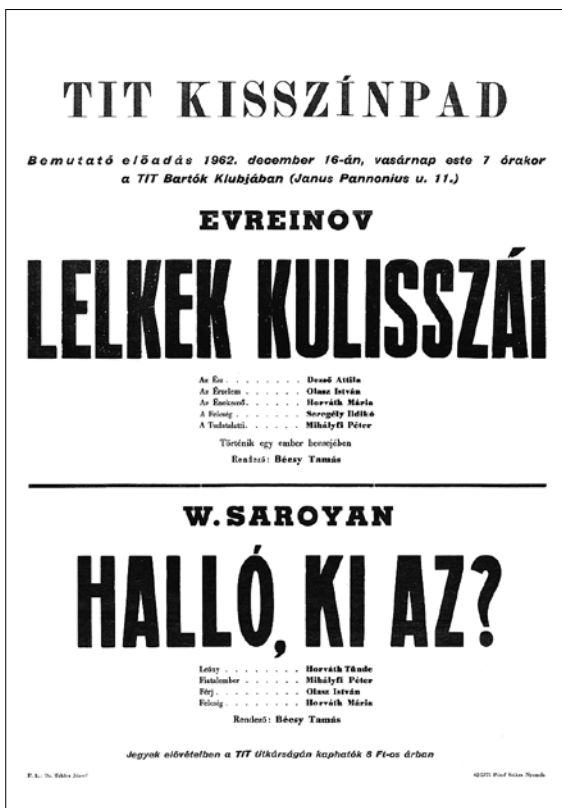
1. kép A Zsebszínház első előadásának bemutató plakátja