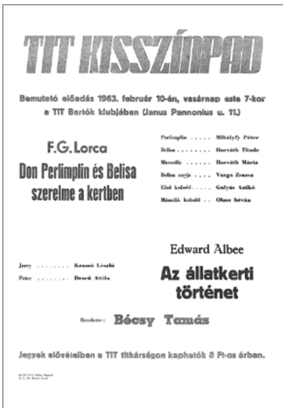
2. kép A Zsebszínház 1963. február 10-i előadásának bemutató plakátja

újat alkothat, hogy a főváros is tanulhat tőle. Erre jöttek rá a pécsiek. Megteremtették a balettjüket, érdekes színházelméleti és drámatörténeti műhelyt szerveztek, mely Bécsy Tamásék zsebszínházának alapjait adta meg. E munkák résztvevői és nézői nem érzik száműzetésnek a vidéket, és azt akarják, hogy városuk ne másolt Pest, hanem eredeti Pécs legyen.” 44