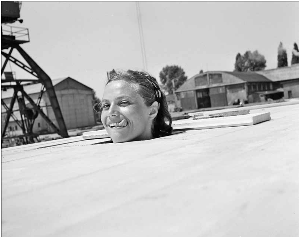
Épül a balatonfüredi tutaj színház, 1963.