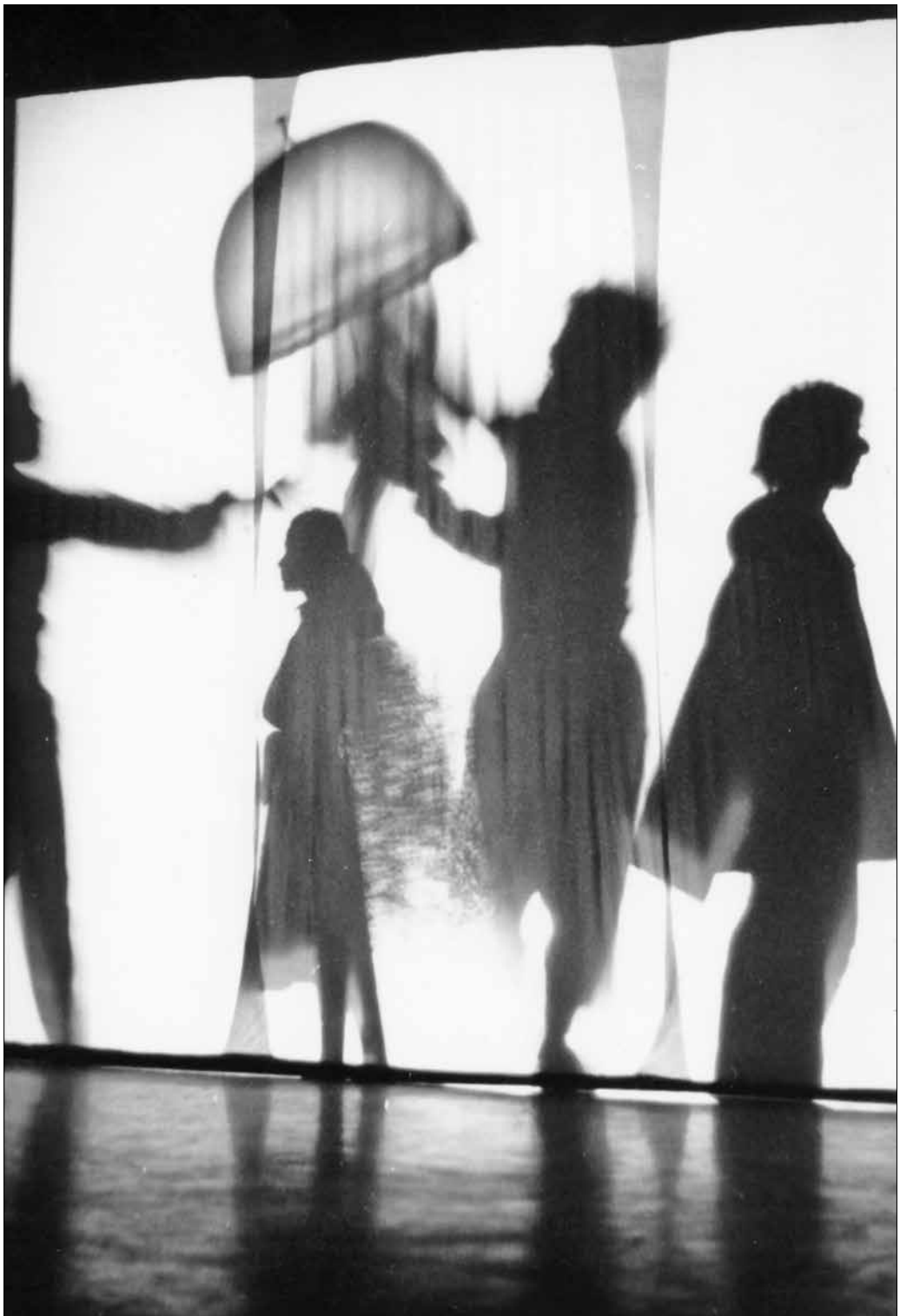
Boldog vagyok. Előadja a Kreatív Mozgás Stúdió együttes, 1986.