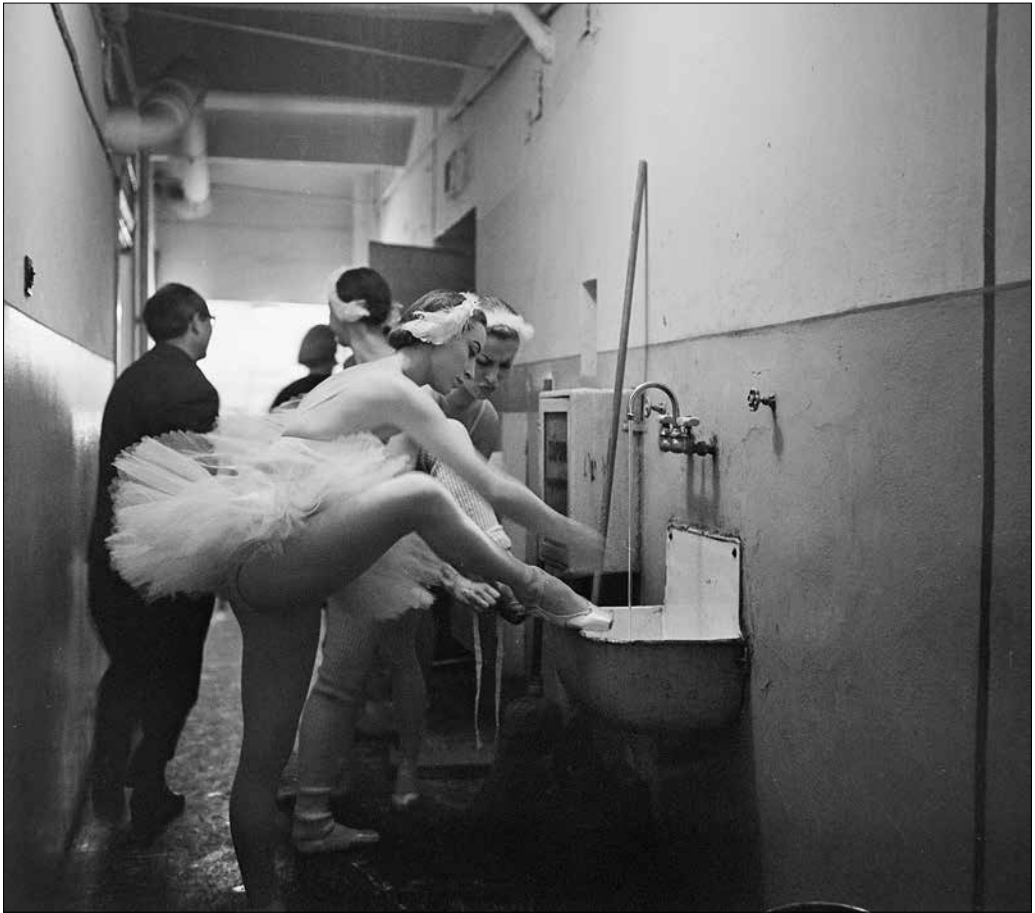
Az Erkel Színház balerinái a cipőjüket nedvesítik, 1964.