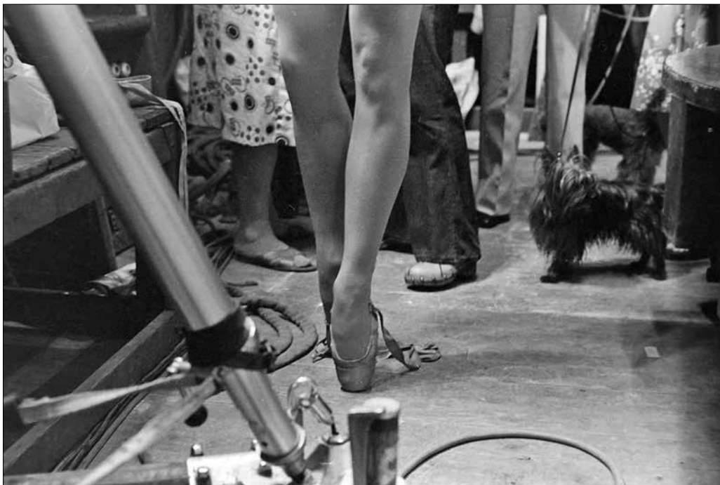
Maina Gielgud, a londoni Royal Ballet prímabalerinája televíziós felvételre készül, 1975.