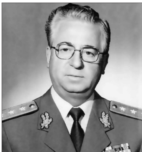
2. kép Iulian Vlad vezérezredes, a Securitate tényleges vezetője 35

szakban országos szinten 32 800 adatolt esetet rögzítettek: 8 495 személy sikeresen átjutott a határon, míg 21 565 személyt a román szervek tartóztattak fel, valamint 2 740, a szomszédos államok által viszatoloncolt ember ellen indítottak eljárást. 32 1981 és 1985 között összesen 16 412 esetet regisztráltak, 14 017 személy volt román származású, 1 272 német, 649 magyar és 474 más nemzetiségű. 33 Az I. Belső Hírszerzési Igazgatóság 1984 decemberében kelt éves összefoglaló jelentésében említi először, hogy a Magyarországra szervezett formában kiutazó, magyar ajkú román állampolgárok és a hazatérést megtagadók száma megnövekedett. 34 Az országelhagyások számának csökkenő tendenciája 1980-tól