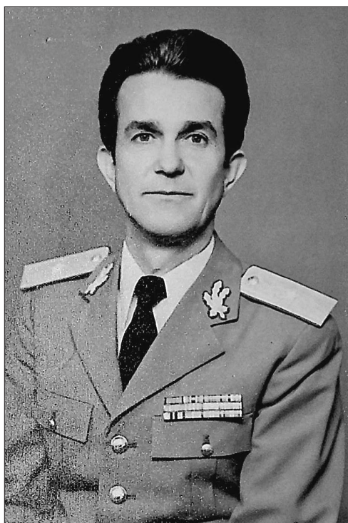
3. kép Aron Bordea vezérőrnagy 45

1988 áprilisában újabb intézkedéseket hoztak a jelenség megakadályozására, így a Nemzetvédelmi Minisztérium engedélyével a hadseregtől 800 közkatonát csoportosítottak át, hogy erősítsék a román–magyar határszakasz járőrvédelmét. Elrendelték az érintett határ menti megyék, Szatmár, Bihar és Arad teljes állambiztonsági és milíciabeli hivatásos állományának, hogy tíznaponként eligazítást és képzést tartsanak a támogató és a hálózati személyeknek, hogy növelni lehessen az operatív jelzések számát. A határőrség parancsnoksága, a BM I. Belső Hírszerzési Igazgatósága (Direcția I. Informații Interne), a IV. Katonai Kémelhárító Igazgatósága (Direcția a IV-a Contrainformații Militare) és a Milíciá Főigazgatósága (Direcția Generală a Miliției) havi rendszerességgel elemző-értékelő jelentést készített a helyzet alakulásáról. 46