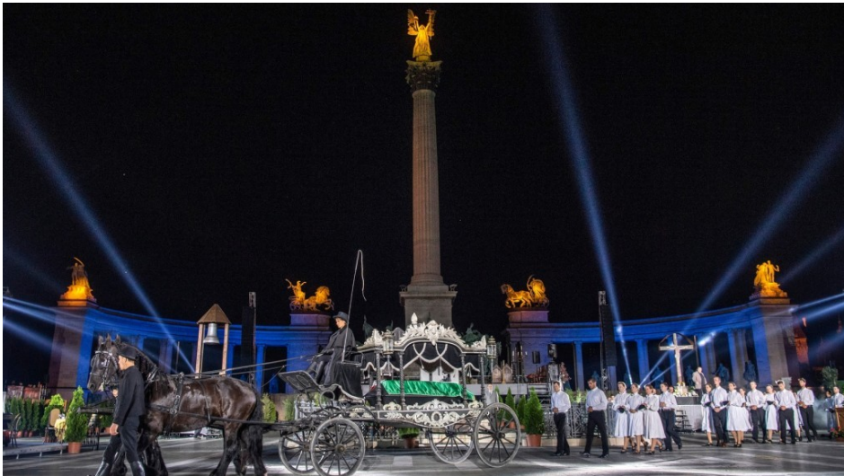
1. kép Részlet Koltay Gábor: Trianon című rockoperájából https://www.hirado.hu/kultura-életmod/szinhaz/galeria/2018/06/22/a-trianon-cimu-rockopera-foprobaja-a-hosok-teren/ Letöltés ideje: 2019. szeptember 17.

A Trianont 2004-ben mutatták be, az Európai Unióhoz való csatlakozásunk évében, és kimondható, hogy erős igény mutatkozott rá, mert a csatlakozásunktól való ódzkodás nem tűnt elszigetelt jelenségnek. Koltay meg is fogalmazta ezt: „ A kérdés úgy is felvethető, hogy a 21. században vagy vazallusi függőségbe kényszerített néppé silányodunk, vagy képesek leszünk a nemzeti felemelkedésre. ” 9 S mintegy filmje ars poeticájaként irányt mutat, szerinte mit kell tenni: „ Ha meg akarjuk érteni, hogy az 1990-es közép-kelet-európai rendszerváltozások után miért vagyunk még mindig rosszkedvűek [...], miért érzi a magyar nép többsége azt, hogy a rendszerváltás felemás módon zajlott le, ahhoz fel kell dolgoznunk a 20. század történéseit. Vissza kell nyúlunk az ősbűnhöz, 1920-hoz, Trianonhoz, és be kell mutatnunk azt a 85 éves folyamatot, amely azóta is tart. ” 10