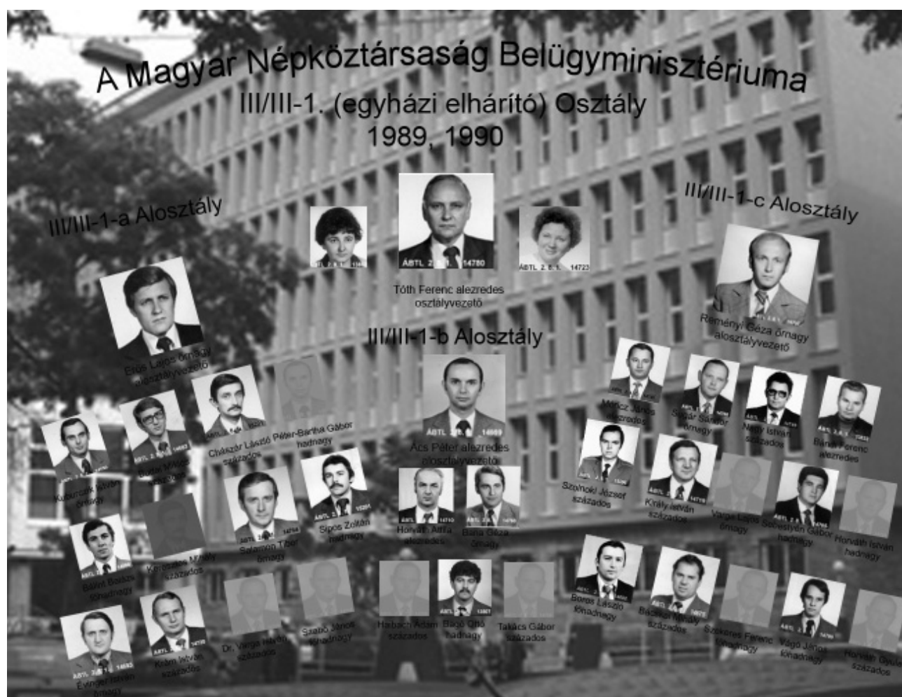
A BM III/III-1 Osztály munkatársai 1989–1990-ben

Az egyházi elhárítás (BM III/III-1. Osztály) 1989-es tablóján három tucat állambiztonsági tiszt helyezhető el. A személyi dossziékban megőrzött igazolványképek alapján grafikusán is elkészíthetővé vált egy minden bizonnyal sohasem létező osztálytábló. Ennek megalkotásához 27 fotót sikerült feltárni eddigi kutatásaim során, kilenc beosztottnak nem található személyi anyaga a levéltárban. Bár az összeállítás abból a szempontból is fiktívnek tekinthető, hogy a felvételek valószínűleg nem egy időpontban készültek, mégis e montázs révén szembesülhetünk először egy elhárítási terület teljes (központi) állományával.