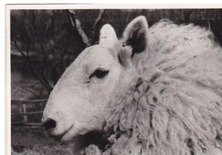
Cap de oaie Colbred

(ACNSAS fond OVS, 2871. dosszié, 16 kötet, 31.)