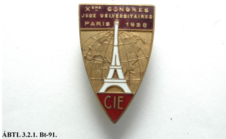
ÁBTL 3.2.1. Bt-91.

Az 1928-as párizsi egyetemi játékok kítűzője egy „Fertői” (később „Fairfield”) fedőnevű ügynök működésével kapcsolatos. 9