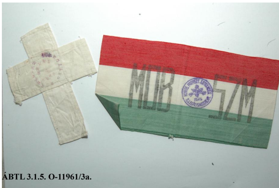
ÁBTL 3.1.5. O-11961/3a.

1951 tavaszán Budapest több pontján, Székesfehérváron, Sátoraljaújhelyen, valamint Miskolcon és környékén több ezer példányban röpcédulákat szórtak. 33