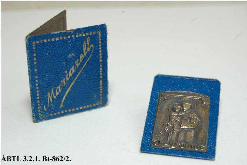
ÁBTL 3.2.1. Bt-862/2.