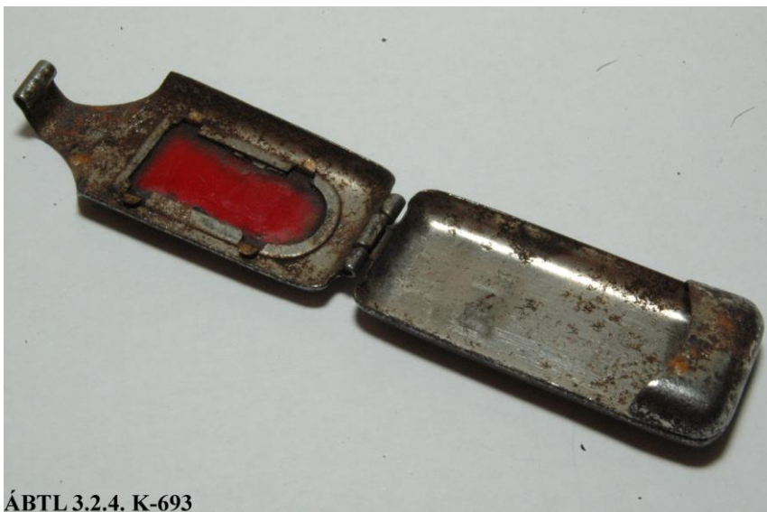
ÁBTL 3.2.4. K-693