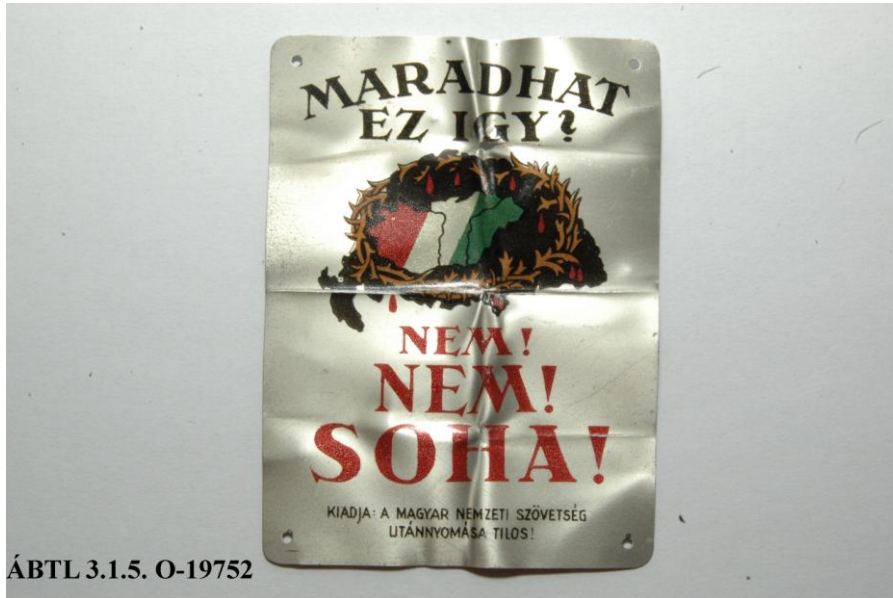
ÁBTL 3.1.5. O-19752

A Szolnok megyei Rendőrfőkapitányság III/III. Osztálya 1988 márciusában „Piktor” fedőnéven indított bizalmas nyomozást annak felderítésére, hogy ki festett a szolnoki MÁV-pályaudvar aluljárójának falára „vezető személyiségeket sértő” – Kádár Jánost és Grósz Károlyt szidó, helyesírási hibákkal teli – feliratokat neolux spray-vel. 22 Másnap, március 15-én hasonló tartalmú feliratokat találtak egy garázs ajtaján, valamint a Széchenyi lakótelep néhány házának falán.