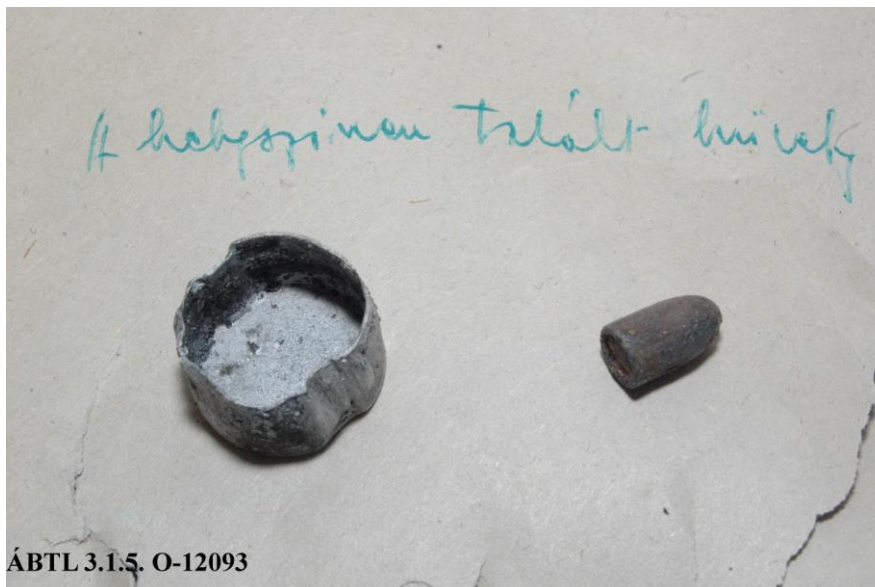
ÁBTL 3.1.5. O-12093

A képeken látható töltények, töltényhüvelyek, fiolák (benné égéstermékkel) egy olyan ügghöz kapcsolódnak, amelynek felderítésére a BM III/III-1-b alosztálya rendkívüli esemény dossziét nyitott 1963-ban. 21