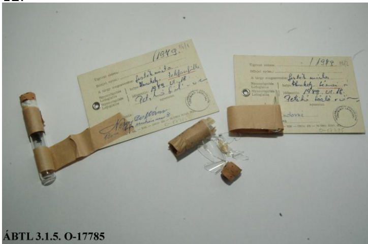
ÁBTL 3.1.5. O-17785

Néhány héttel később valaki a szolnoki Léna étterem férfi WC-jének falára horogkeresztet festett, s a falfirkálások ügyében egyébként is adatgyűjtést végző operatív tiszt ekkor találta meg a képen látható, Trianonra emlékeztető kis fémtáblát.