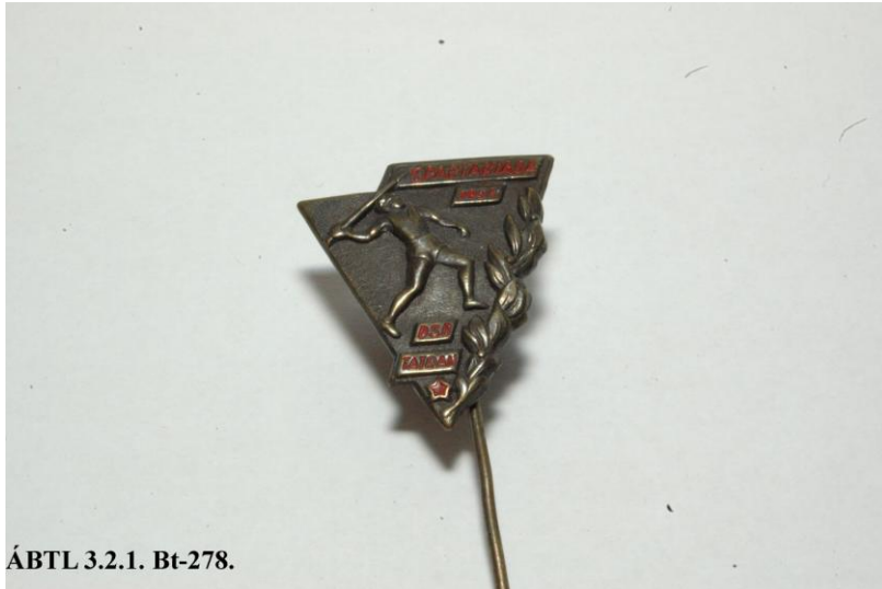
ÁBTL 3.2.1. Bt-278.

A „Spartakiada 1954” feliratú apró kitűző a „Rákóczi” fedőnevű ügynökkel való kapcsolatba lépést segítette. 10