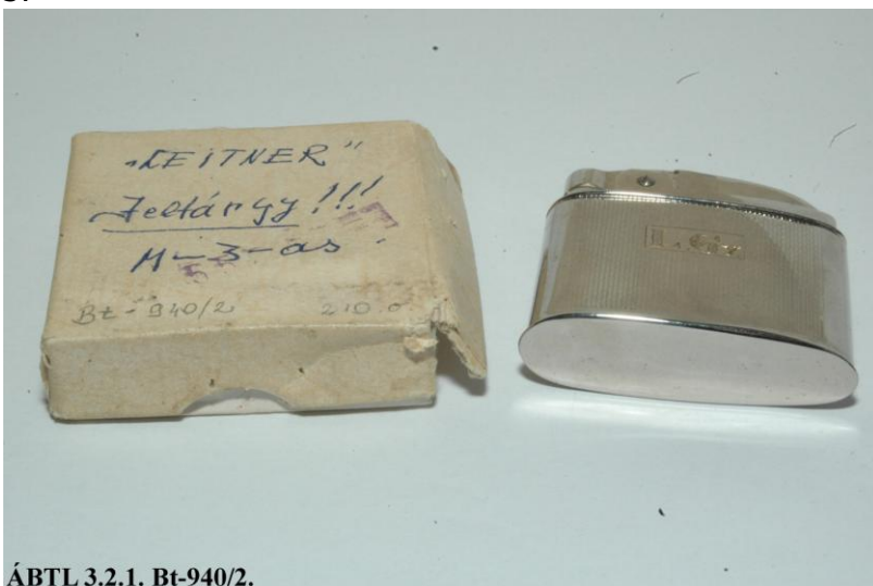
ÁBTL 3.2.1. Bt-940/2.

Az L. Gy. monogramot viselő Mofém Meteor márkájú öngyújtó az „Ottó” (majd „Lócsei Béla”, végül „Franz Leitner”) fedőnevű ügynökkel való kapcsolatfelvételt szolgálta. 8 A banktisztviselő, de újságírással is foglalkozó ügynök a felszabadulás után önként ajánlotta fel szolgálatait a politikai rendőrségnek.