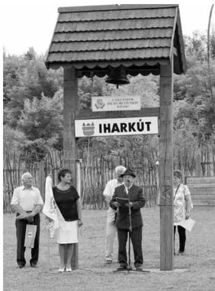
Az Iharkúti Emlékpark a haranglábbal

A szomszédos község, Németbánya temetőjében megépült az Iharkúti Hősi Emlékmű , rajta a két világháború hősi halottai és az 1948-ban kitelepített németajkú lakók neveivel. Az eltelt csaknem négy évtized alatt a táj krátersebei begyógyultak, de az iharkútiak lelkén ejtett sérülés talán sohasem múlik el. A szülőföld iránti szeretetet nem lehet kitörölni az emberek lelkéből. Iharkút egykori lakói évek óta egyre több jelet állítva bizonyítják szülőföldjük iránti ragaszkodásukat. Nincs még egy olyan falu, melynek megszűnése után lett volna címere, címeres zászlaja és ötkötetes monográfiája! (A monográfiát az iharkúti kötődésű dr. Tölgyesi József főiskolai docens állította össze.) Iharkút nevét mégsem ezért ismerte meg az ország és a tudományos világ, hanem a bauxit kibányászása után a dr. Ősi Attila paleontológus és társai által felfedezett, nyolcvanmillió évvel ezelőtt élt dinoszauruszok maradványairól.