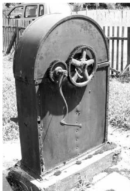
Zuhatagkút a Straub kocsmá udvarán

Az ipari és műszaki megoldások kategóriában egyetlen értékünk van, a Zuhatagkút, mely olyannyira jelentős, hogy a Veszprém Megyei Értéktárba is bekerült. A Zuhatagkút ékes példája annak, miért is kellenek az elhivatott lokálpatrióták a helyi értéktárakba: hogy a düledé-