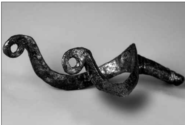
Kalapált vas sarkantyú (15. század)