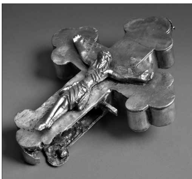
Ezüst ereklyetartó Krisztus-korpusszal (15. sz.)