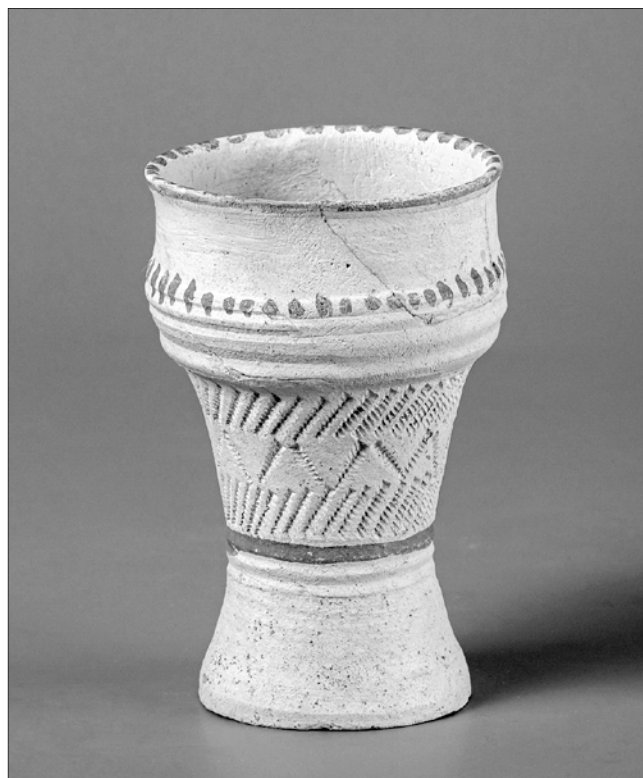
Fehér mázas kerámia pohár vörös festéssel (15-16. sz.,)