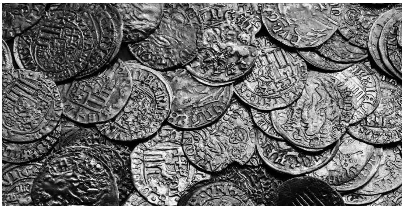
Cserép perselyből előkerült ezüst pénzérmék a 15.-16. századból