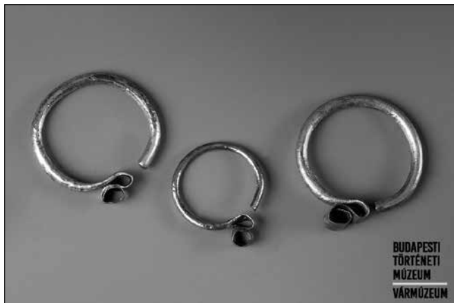
Árpád-kori, s-végű ezüst hajkarikák (13. sz.)