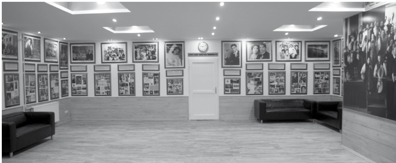
Belső tér a Központban