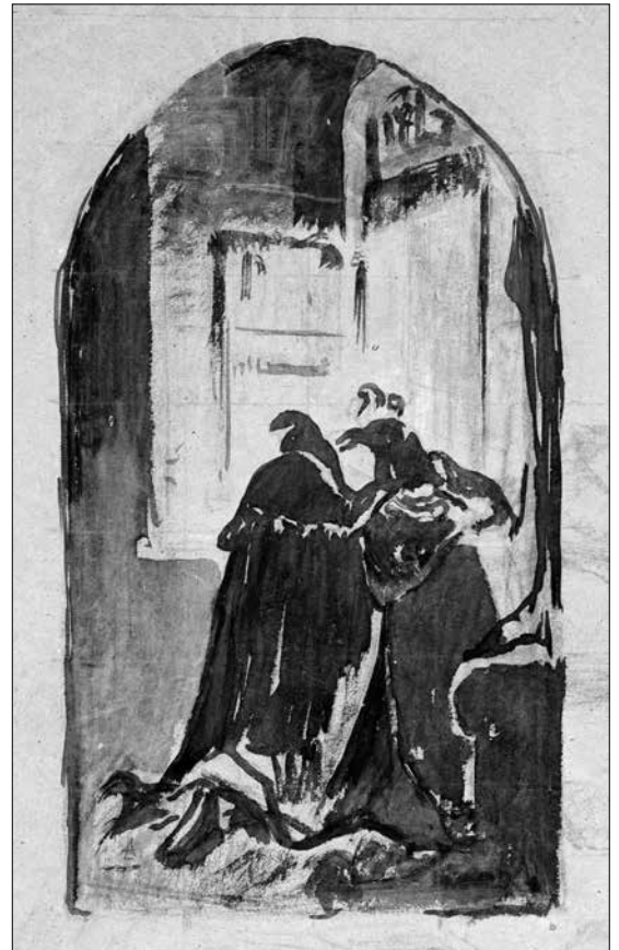
Liezen-Mayer Sándor: Faust és Mefisztó a párbaj után

1870-es évek első fele, tus, toll, ecset papíron