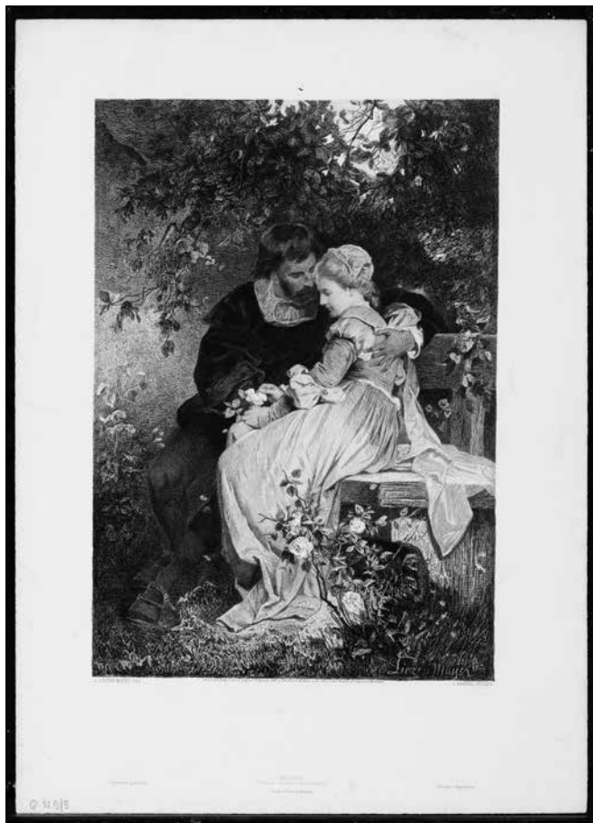
Liezen-Mayer Sándor: Faust és Margit a börtönben; Margit és Faust a kerti padon (1876 körül, acélmetszet)

megoldást alkalmazó – műtervezeteket tárt a közönség elé. A „hab a tortán” három, a témába vágó, kisebb-nagyobb olajkép.