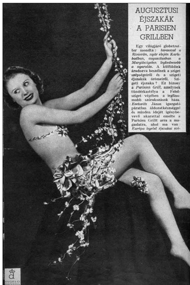
A Margit-szigeti Parisien Grill egyik görlje

korabeli újságcikk-kivágás idézi egy globetrotter, azaz egy leginkább csak szórakozási vágytól fűtött világutazó szavait: „...tavasszal a Rivierán, nyár elején Karlsbadban, augusztusban a Margitszigeten legkedvesebb a nyaralás”. A külföldiek áradozva beszélnek a sziget szépségeiről és a szigeti éjszakai örömeiről: „a Parisien Grill tündérekastélya a Felső-sziget végében a legfinomabb szórakozások háza.” A számos kisebb-nagyobb mulatóhely (előkelősködő korabeli szóhasználat) élve: „dancing”) közül nem egy hamar tönkrement, tiszavirág életűnek bizonyult, a két hajdani luxusmulató – az Arizona és a Moulin Rouge – egykori híre-rangja azonban a mai napig tovább él.