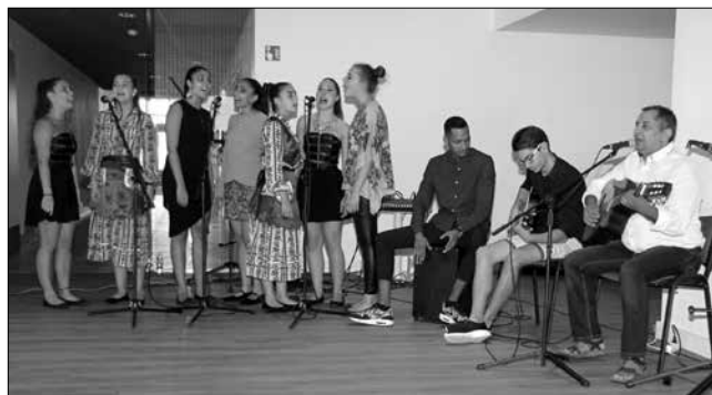
A Romano Glaszo Művészeti Együttes adott esti programot

A rendezvény minden tekintetben sikeres volt. A résztvevők életre szóló élményekkel gazdagodtak. A vasárnapi táborzárót követően számos új barátság-