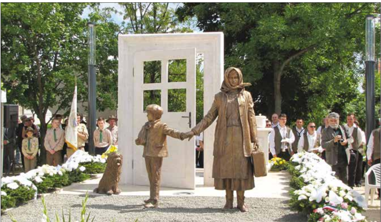
Az „Elűzetés” című emlékmű Kligl Sándor szobrászművész alkotása