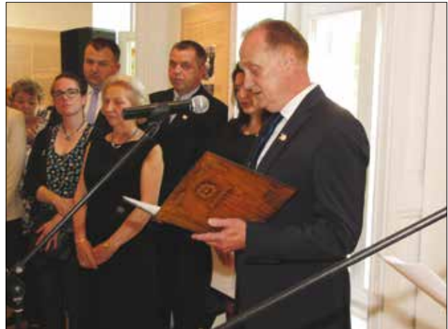
Geiger Ferenc polgármester megnyitó beszédét tartja