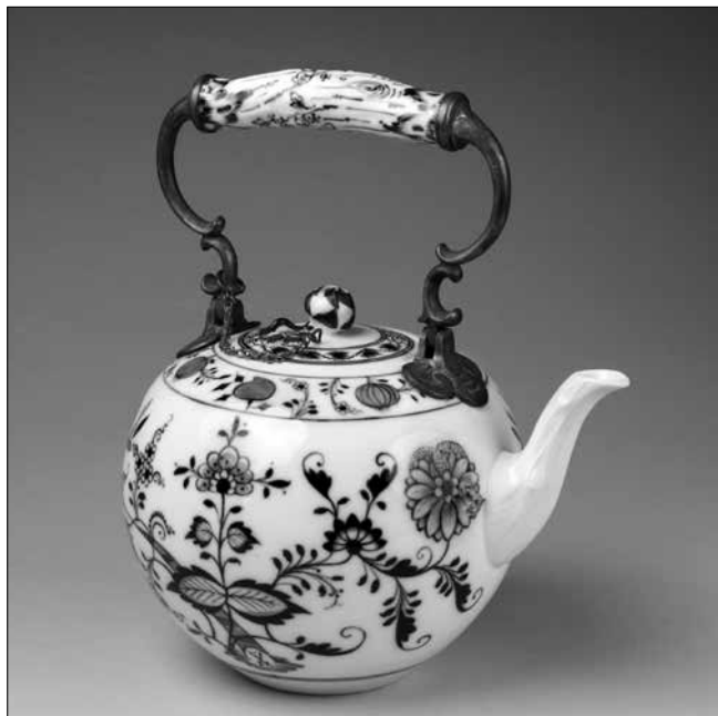
Hagymamintás meissen porcelán teáskanna