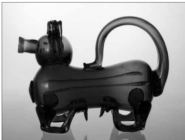
Kutya alakú kobaltüveg kancsó Erdélyből (1700 körül)

A vörös terem „főszereplője” Esterházy Pál esküvői díszruhája 1680 tájáról, a már korábról is ismert, barokkos burjánzású aranszálás hímzéssel beborított, bordó olasz selyembrokát dolmány. Az 1779-es tescheni békekötés emlékére Felső-Lausitzban szőtték azt a szintén itt látható színjátszó bíbor selyemdamaszt díszterítőt, amelyet jelképes alakokkal és hadi trófeákkal, valamint pompázatos gót betűs