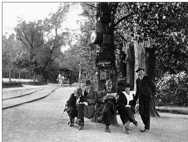
A margitszigeti lóvasút megállója

A Vasárnapi Ujságban közzétett „A pesti közúti vaspálya közlekedésének teljes programja” szerint „A pesti lóvonatu vasút e hó 1-jén a közforgalomnak megnyitván, a rendes vonatok menetrendét az igazgatóság következőleg állapítja meg: [...] Az Újpestig közlekedő vonatok a következő állomásokon fognak megállapodni: Szénatér, Zrínyi-kávéház, Deák-tér, lipótvárosi templom, államvasuti indóház, kis-sör csarnok. [...] A társaság minden kocsiján ellenőrzési jegyek vannak használatban, melyeket a kocsivezető köteles minden beszállónak láttára a szelvénykönyvből kiszakítani és a vitelbér letétele mellett