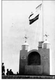
Musza Dagh-i emlékmű

hadsereg érkezett a Musza Dagh lábához. A törökök két napon át meg-megújuló hullámokban támadták az örményeket, sikerült is elfoglalniuk ez egyik megerősített állást a hegyoldalban. Az éjszaka közeldével itt lepihentek, s úgy tervezték, napkelte után folytatják a támadást. Ám az örmények nem várták be az újabb rohamot, körbezárták és visszaverték a betolakodókat. Török oldalon ezer fős veszteséget jelentettek be, s bár az örmények is temették a halottaikat, a gyász óráit elviselhetővé tette a tudat, hogy a harc során jelentős mennyiségű lőszert és fegyvert zsákmányoltak az ellenségtől.