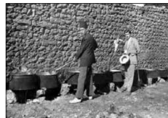
Rituális harisza-főzés, 1920-as évek