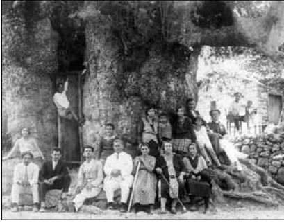
A khederbeki platánfánál