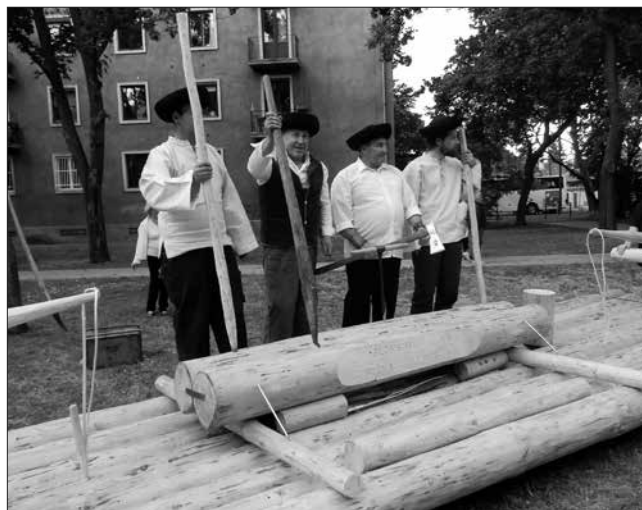
A szerző felvételei a táblaavatáson, a Tutaj utca sarkán, majd a XIII. ker. Szlovák Önkormányzat által szervezett tutajépítésen és szimpóziumon készültek.