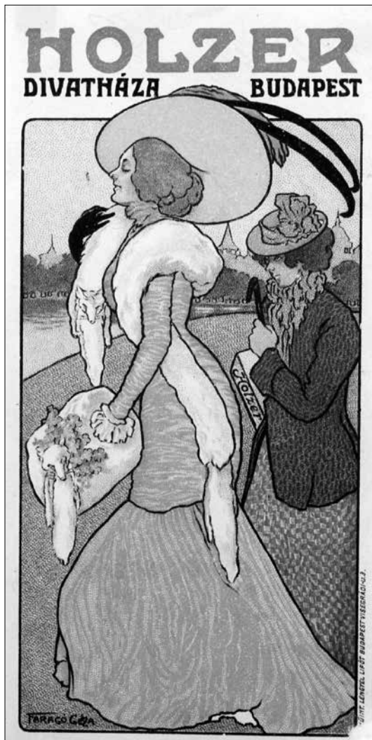
Faragó Géza: Holzer Divatház számló- cédulája (1900-as évek vége)