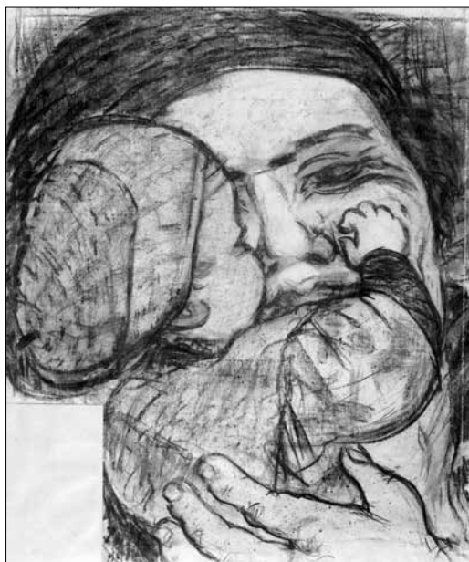
Derkovits Gyula: Anya (1934)