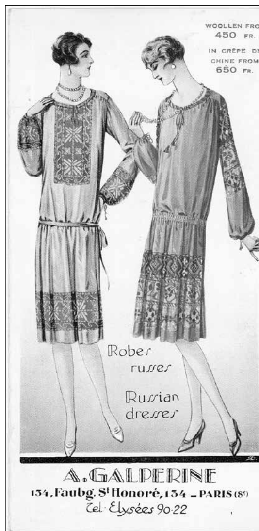
Párizsi divat – orosz folklor modorban (1920-as évek)