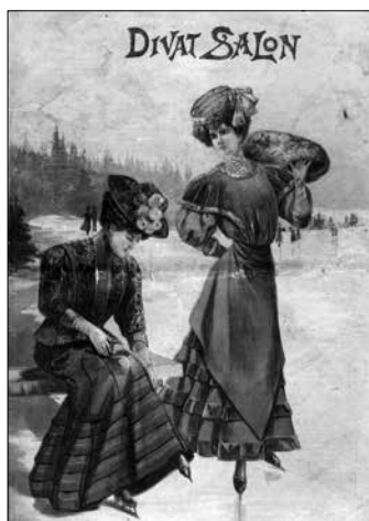
A „Divat Salon” címlapja (1906)