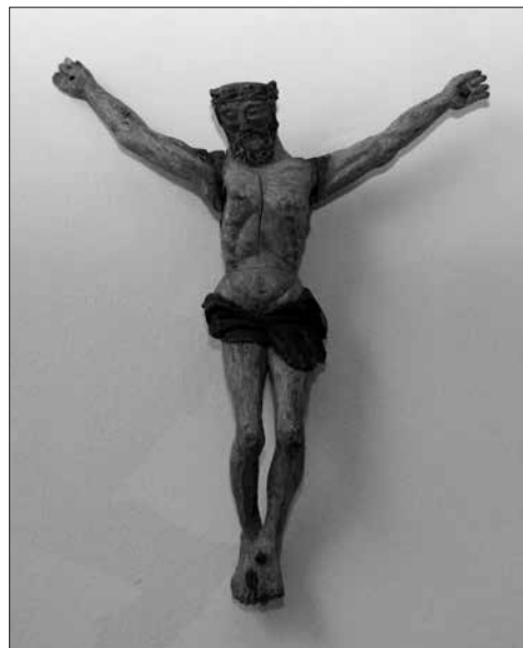
Korpusz, amit a német betelepülők az óhazából hoztak magukkal