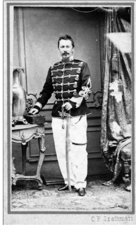
Alexandru Ioan Cuza uralkodó díszgyűjteményében (1876)