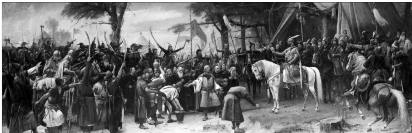
Munkácsy Mihály: Honfoglalás (1893)

Az „Ész, erő és oly szent akarat...” feliratú részleg a magyar reformkor előremutató személyiségeit sorakoztatja fel. Itt hívjuk fel a figyelmet egy másik