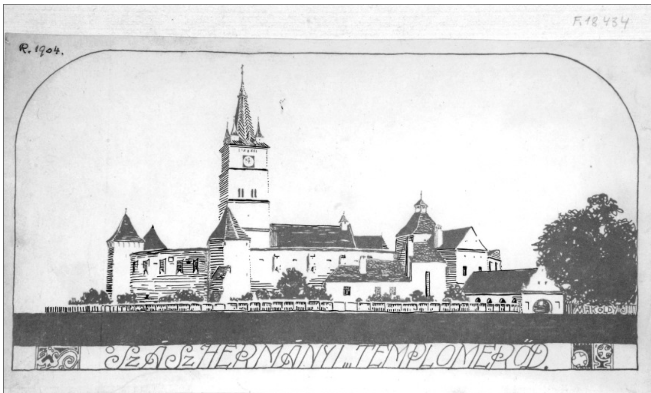
Makoldy József: A szászhermányi erődtemplom (1912) linotípia

Az előbbi első írásos említése 1235-ből való, szárnyas oltára 1450 körül készült, a XV. században a török terjeszkedés miatt bástyákkal és kettős védőfállal vették körül, amelyből a külső nem maradt az utókorra. A belső várfal mentén 275 kamra épült, ahol a lakosok az értékeiket őrizhették és maguk is meghúzódhattak a veszélyes időkben. Még iskolatermet is építettek a hosszabban tartó ostromzárak idejére. Evangélikus temploma a Ceausescu-diktatúra idején bekövetkezett tömeges német kivándorlás miatt