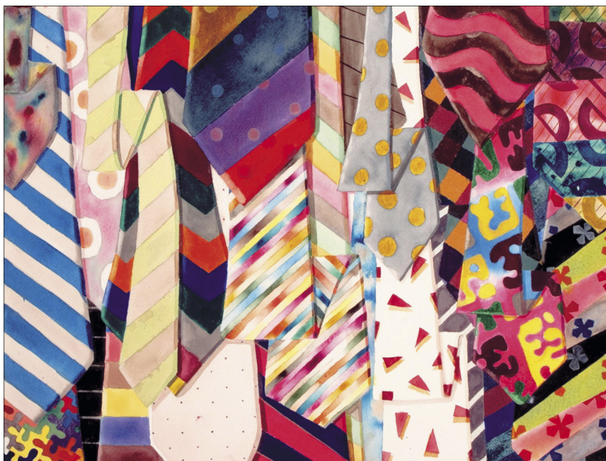
Gesztelyi Nagy Zsuzsanna: Nyakkendők (2006, 46 x 61 cm, akvarell, papír)